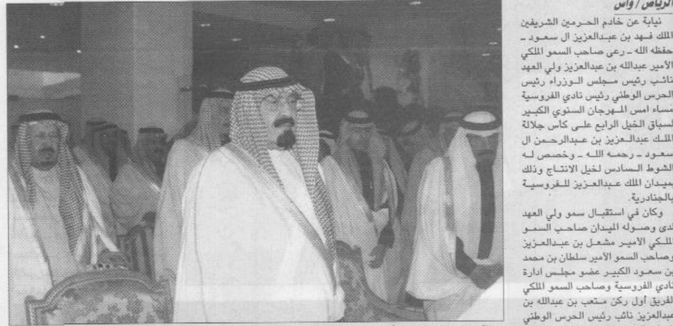
الأمير عبدالله أثناء عرق السلام الملكي وصاحب السمو الأمير سلطان بن محمد الدرجة الثالث (انتاج) على جائزة الأمير عبدالله بن سعود بن عبدالله آل سعود ومسافته ١٦٠٠م ومقدار جائزته ٢٢ الف ريال وجاءت نتيجته على النحو التالي: الاول / شعاعة لابناء الأمير محمد ابن سعود الكبير الثاني / حزوي خالد بن عبدالعزيز ابن سعود الكبير الثالث / معشوقة لابناء الأمير محمد ابن سعود الكبير الرابع / بارقة شقران لابناء الأمير محمد بن سعود الكبير الخامس / عطايا الله لابناء الأمير عبدالله بن عبدالعزيز والشوط الثاني كان مفتوح الدرجات (افراس انتاج ٣ سنوات) على جائزة الأمير فهد بن إبراهيم بن مشاري آل سعود ومسافته ١٦٠٠م ومقدار جائزته ٢٠ الف ريال على النحو التالي: الاول / غيلان لهيف بن محمد بن عبد العزيز الثاني / الفيلانة لسمو الأمير فيصل ابن خالد بن عبدالعزيز