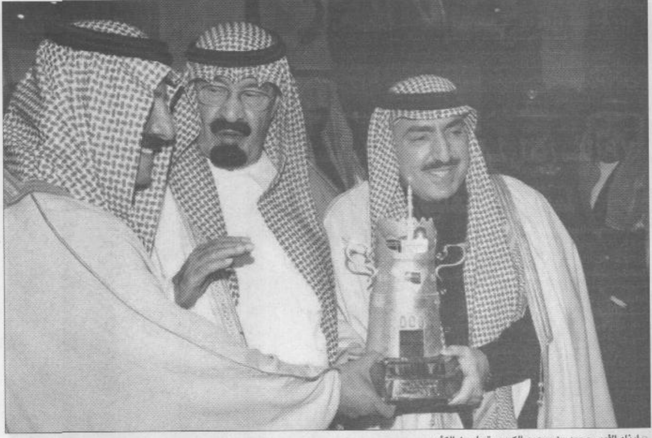
ابناء الأمير محمد بن سعود الكبير يتسلمون الكأس