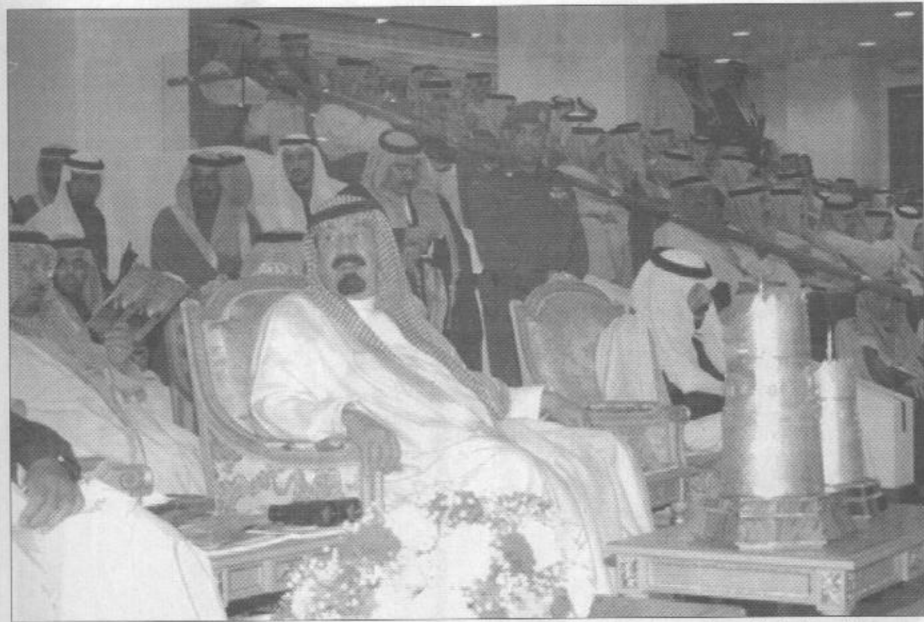
سمو ولي العهد يتابع فعاليات حفل