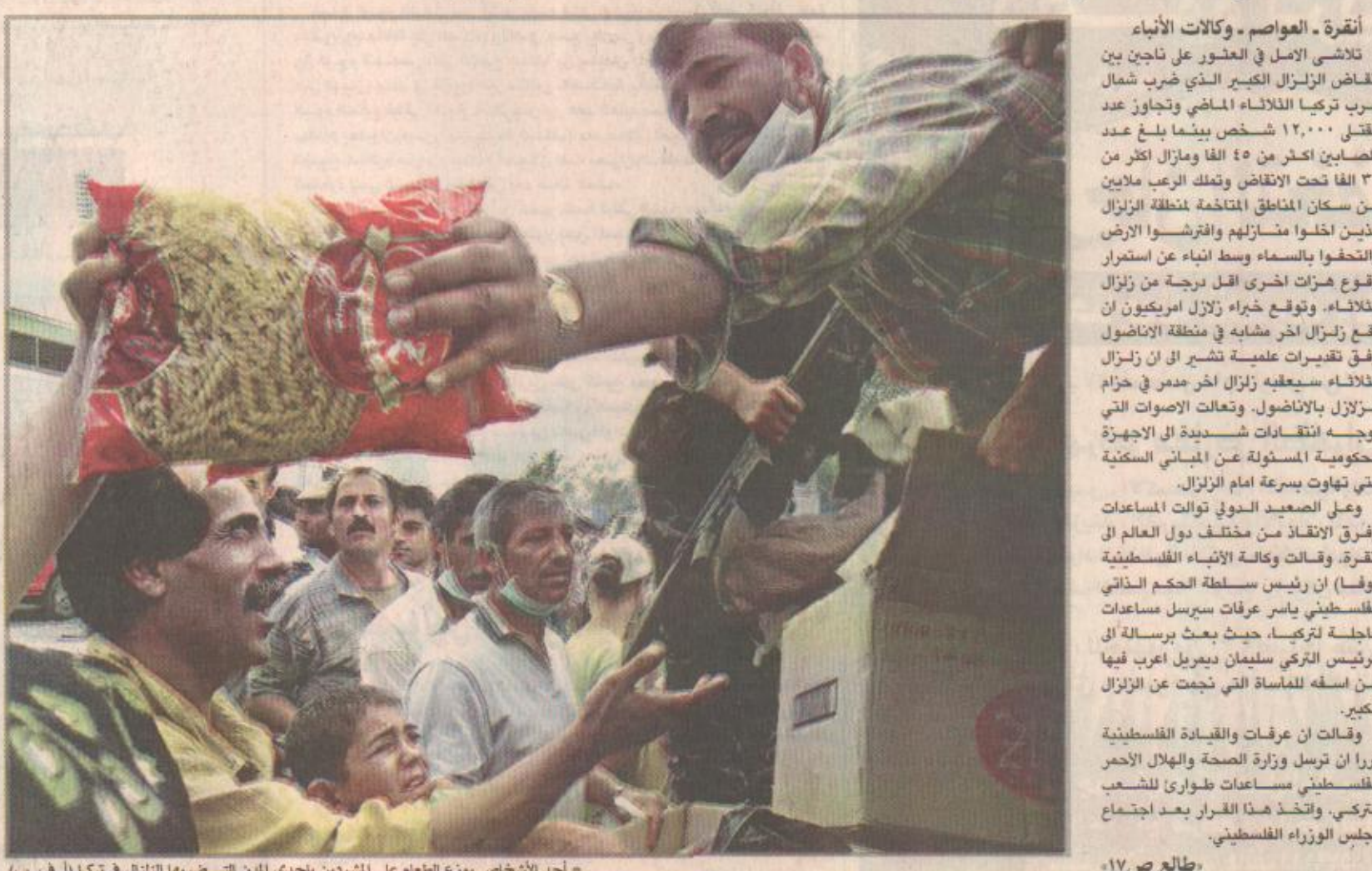
أحد الأشخاص يوزع الطعام على المشردين بأحدى المدن التي ضربها الزلزال في تركيا