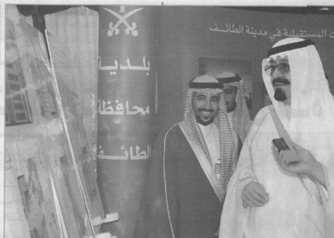
• تقطات من حفل الافتتاح

وأشار سموه الى ان هناك قضايا وتقييمات للاوضاع ستتيح زيارة الوزير الإيراني بحثها الى جانب القضايا التي تهم البلدين الشقيقين.