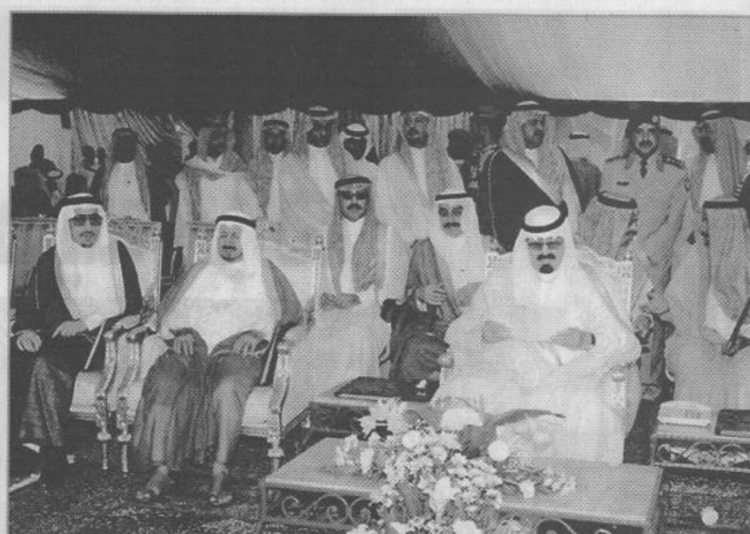
• تقطات من حفل الافتتاح

وفي نهاية الجولة تشرف معالي محافظ الطائف فهد بن