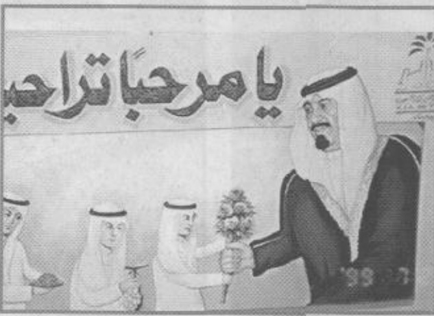
لقطة ترحيبية لنائب خادم الحرمين الشريفين

وخمسون طالبا وعدد المعلمين قرابة ثمانية آلاف ومائتين وتسعة وخمسين معلما. وقال إن الفرح والسعادة الغامرة بهذه المناسبة الغالية على نفس كل مواطن يسكن بهذا الجزء الغالي من بلادنا الحبيبة وقال إنها زيارة الخير المباركة وهي تمثل لآبناء الطائف أكبر حدث تعيشه المحافظة وإنما تحمل الخير لها حيث قام سموه - حفظه الله - بالإطلاع على المشاريع التي تحتاجها المدينة وافتتاحه للعديد من المشاريع. ونسأل الله عز وجل أن يحفظ لنا قائد مسيرتنا المباركة وولي عهده الأمين وسمو النائب الثاني. كما عبر مساعد مدير التعليم بمحافظة الطائف الأستاذ صالح بن محمد الشاذلي بأن هذه الزيارة من قبل سيدي صاحب السمو الملكي الأمير عبدالله بن عبدالعزيز آل سعود حفظه الله على محافظة الطائف تعتبر امتدادا لزياراته لمنطقة المملكة واستمرارا لتواصله مع أبنائه المواطنين في مناطقهم حيث يتأكد من خلال هذه الجولات حرصه الدائم - يحفظه الله - على تلبي حاجات المواطنين وتطلعاتهم التي وإن تكون غير خافية على سموه الكريم إلا أنه في الالتقاء المباشر مع المواطنين ومناقشته أياهم عن قرب ما يميز هذا المنهج المتفرد لسموه في التعامل مع المواطنين. وباسم منسوبي التعليم بمحافظة الطائف نرحب بسموه الكريم في هذه المحافظة.