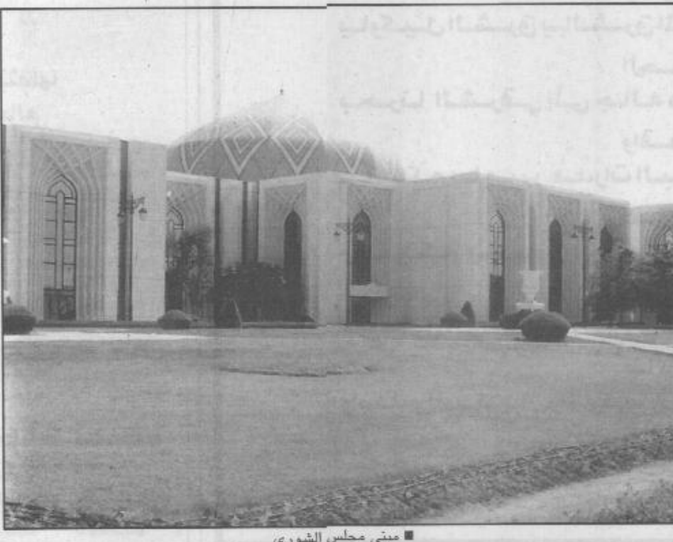
مبنى مجلس الشورى