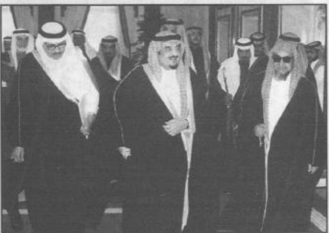
خادم الحرمين الشريفين أثناء دخوله قاعة الاجتماعات