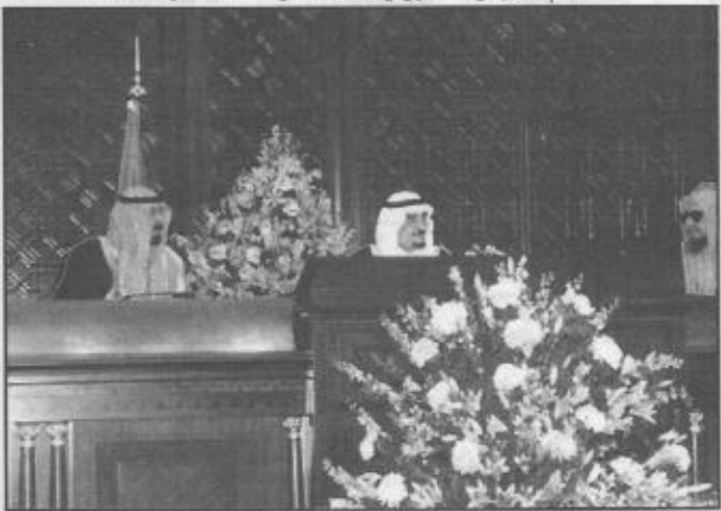
خادم الحرمين الشريفين عند افتتاحه إحدى دورات المجلس