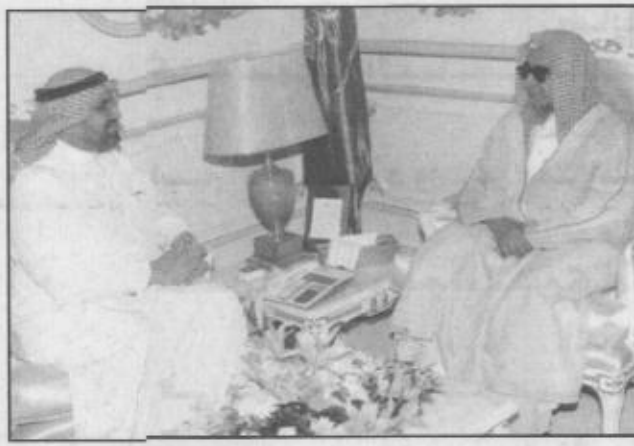
رئيس مجلس الشورى يتحدث لـ اليوم

■ دور المرأة رائد ولا يمكن أن يتكرر ذلك أحد، فالمرأة لدينا وصلت لمراتب