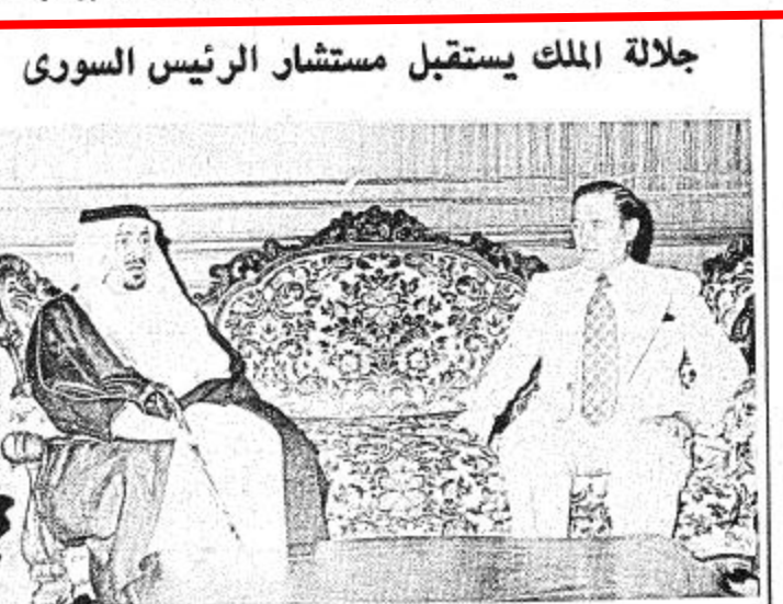
استقبل جلالته الملك خالد بن عبد العزيز المقدم بقصر جلالة بالعلم في الساعة السابعة من مساء أمس السيد اديب الداودي مستشار الرئيس السوري حافظ الأسد السليبي زور الملكة حاليا

ووضو القابلة صاحب السمو الملكي الامير فهد بن عبد العزيز ولي العهد ونائب رئيس مجلس الوزراء وصاحب السمو الملكي الامير عبدالله بن عبد العزيز النائب الثاني لرئيس مجلس الوزراء ورئيس المجلس الوطني وصاحب السمو الملكي الامير سلطان بن عبد العزيز وزير الدفاع والطيران وصاحب السمو الملكي الامير سعود الفيصل وزير الخارجية ومعالى الدكتور رشاد فرعون امستشار القاصي بولاية الملك .. وكان السيد الداودي قد وصل الى الرياض ظهر أمس في زيارة قصيرة للملكة