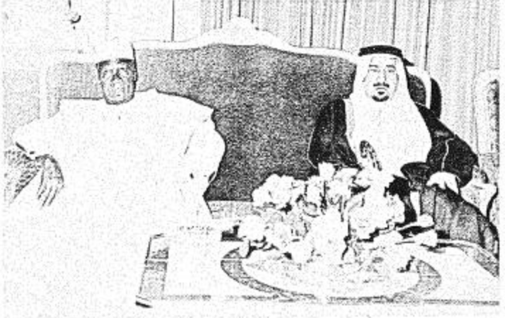
الضيافة المد لتزود ففامة الرئيس سيكتوري كبار مستقبليه صاحب جلالته الملك خالد ضيفه الى الصالة الملكية بالمطار .. وبعد استراحة قصيرة غادر جلالته الملك خالد والضيف الطائر متوجهين بحفل الله ووعايتة الى مصر

تبدأ المحادثات الرسمية بين جلالته الملك خالد بن عبد العزيز المفدى وفضامة الرئيس سيكتوري صباح اليوم وسيغادر فضامة الرئيس سيكتوري الى المدينة المنورة لزيارة المسجد النبوي الشريف والصلاة فيه ثم يغادرها عصر اليوم نفسه متوجها الى جده