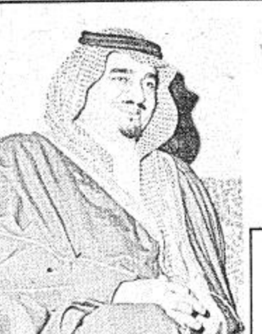
جاء ذلك في بيان اصدره الديوان الملكي الليلة الماضية وقال البيان انه

سيراك سمو ولي العهد في هذه الزيارة وفد يضم صاحب السمو الملكي الامير سعود الفيصل وزير الخارجية وسيدنا من السعودراء وهذا وفد اثار الزيارة التي ستقوم بها سمو الامير فهد بن عبد العزيز ولي العهد ونائب رئيس مجلس الوزراء ليون في الفترة بين ٢١ و ٢٣ يونيو الحالي اهتماما بالغاً في الدوائر الاقتصادية بامانيا الغربية وأوضح اليوم تليف روهوبنو وزير الاقتصاد اممك مجلس الشروعات الهندسية ان المهمة العربية السعودية تحتل في الوقت الراهن المركز الاول بين الدول التي تتعامل تجاريا مع المانيا الغربية