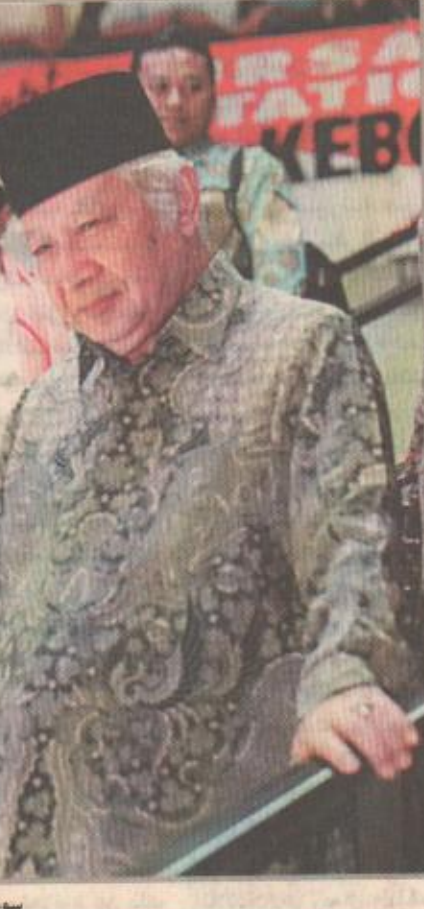
سوهارتو (صورة أرشيفية)

جاكرتا - ا.ف.ب ذكر مصدر طبي ان صحة الرئيس الاندونيسي السابق سوهارتو في تحسن بعد اضطرابات قلبية طفيفة أصيب بها ولكن عليه ان يبقى في المستشفى لأسبوعين او اسبوعين. وكانت مصادر طبية أعلنت يوم الثلاثاء ان سوهارتو أدخل مستشفى برتامينا في جاكرتا لاجراء فحوصات روتينية. وبعد ان سرت شائعات عن وفاته أعلنت السلطات الاندونيسية يوم الأربعاء انه أصيب باضطرابات قلبية طفيفة.