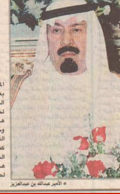
الأمير عبدالله بن عبدالعزيز

غزة/ واس أكد نيبيل ابو ردينة مستشار الرئيس الفلسطيني أن ياسر عرفات سيلتقي مساء غد السبت عند معبر ايريز بين إسرائيل والضفة الغربية برئيس الوزراء الإسرائيلي يهودا باراك. وتلقت وكالة فرانس برس عن ابو ردينة قوله ان عرفات سيبحث مع رئيس الوزراء الإسرائيلي باراك في لقائهما السبت كيفية وسبل تنفيذ الاتفاقيات الموقعة... مشيرا إلى ان المطالب الفلسطيني هو تنفيذ الاتفاقيات بدون تعديل وخصوصا اتفاق واي ريفر والدخول في مفاوضات الحل النهائي.