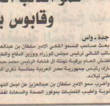
الأمير سلطان بن عبدالعزيز