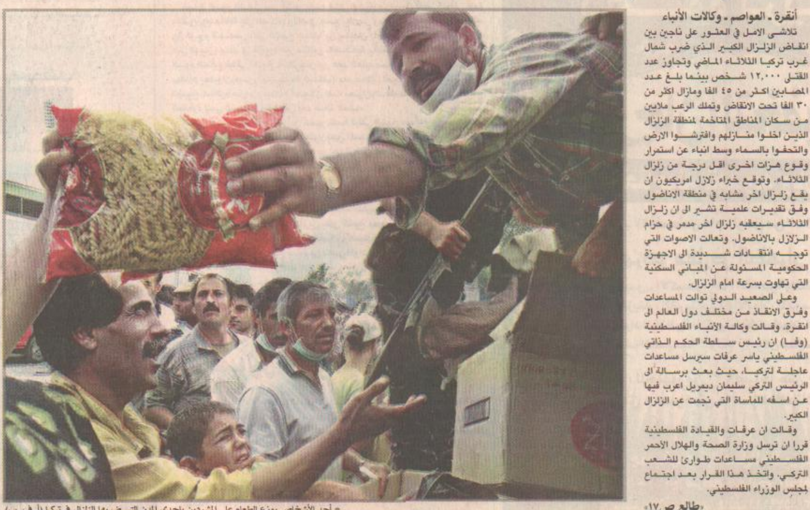
أحد الأشخاص يوزع الطعام على المشردين بأحدى المدن التي ضربها الزلزال في تركيا