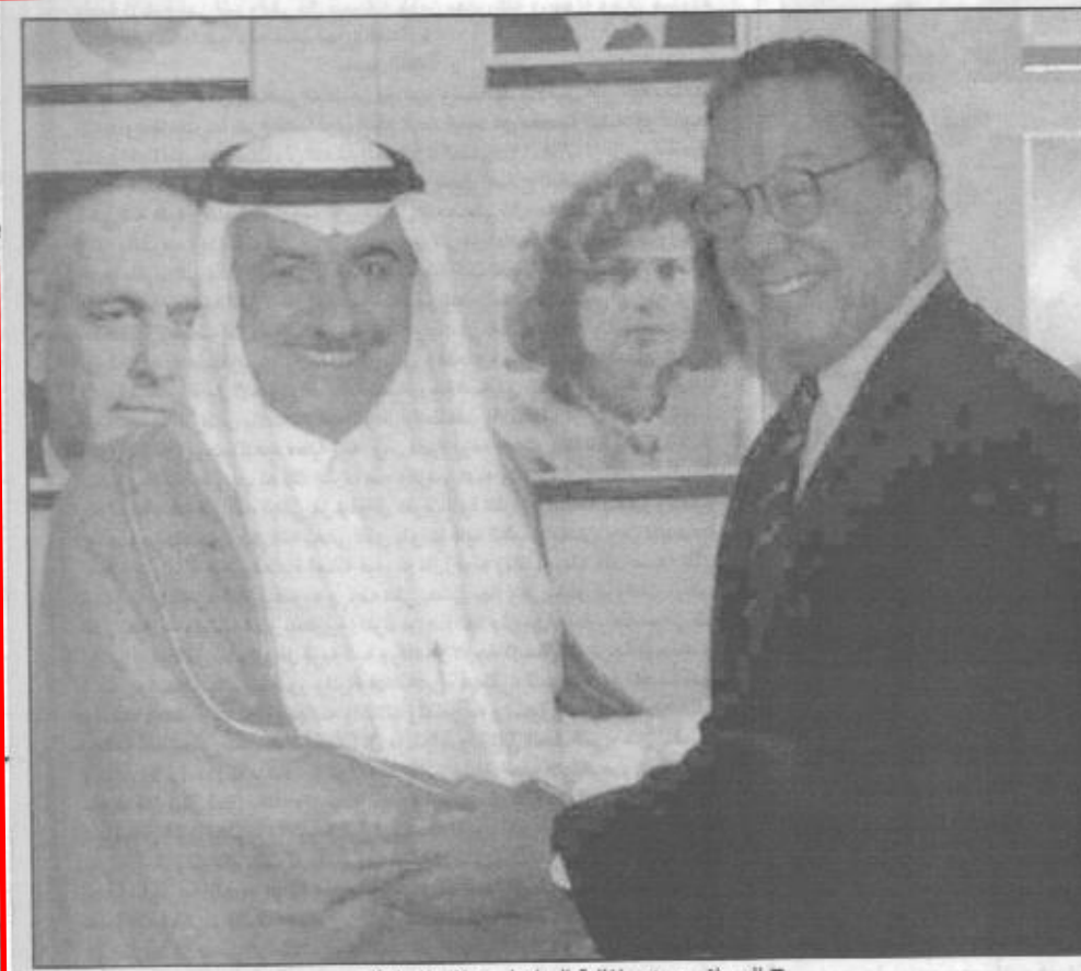
■ العساف ووزير المالية البرازيلي خلال المحادثات