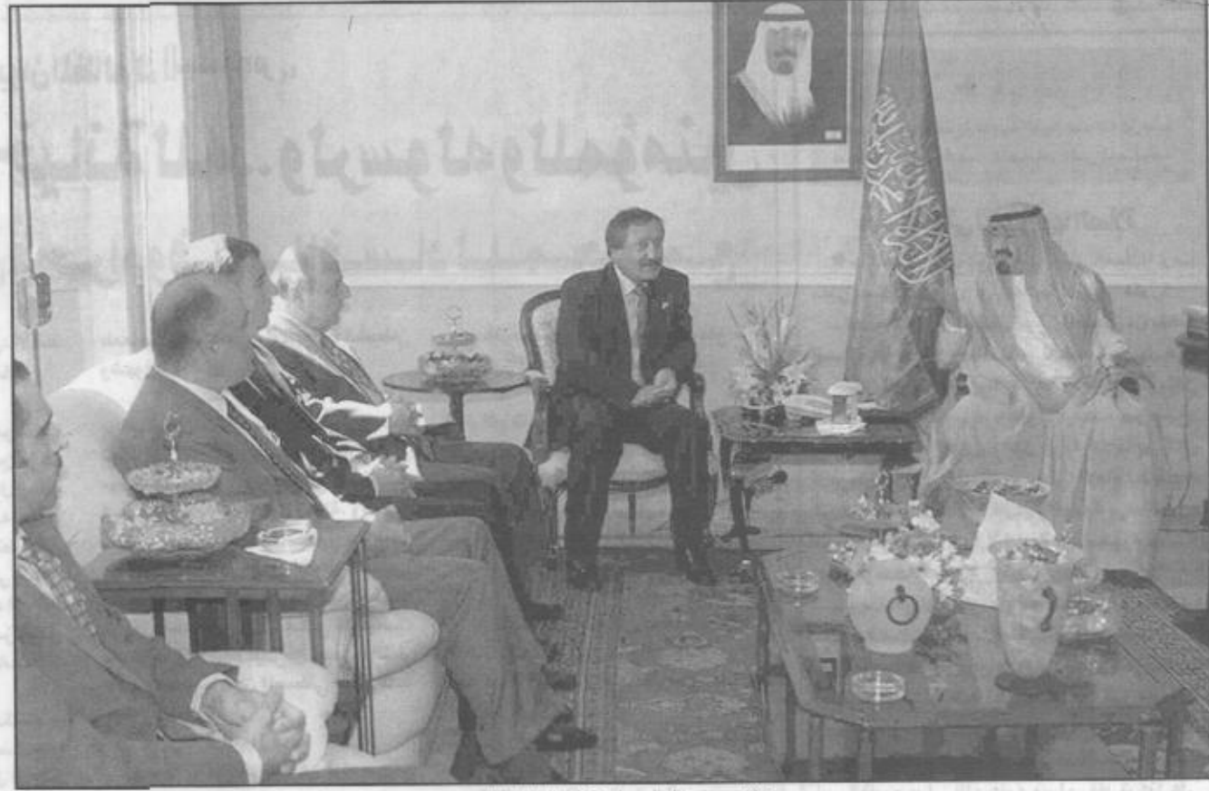
■ الامير عبدالله لدى استقباله السفراء العرب

أعربوا عن تقديرهم لجهود المملكة في خدمة القضايا العربية والإسلامية