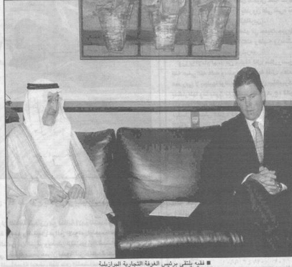
■ فقيه يلتقي برئيس الغرفة التجارية البرازيلية

برازيليا، واس في اطار الزيارة الرسمية التي يقوم بها صاحب السمو الملكي الامير عبدالله بن عبدالعزيز ولي العهد ونائب رئيس مجلس الوزراء ورئيس الحرس الوطني الى جمهورية البرازيل الاتحادية اجتمع امس معالي الدكتور ابراهيم العساف وزير المالية والاقتصاد الوطني مع معالي السيد بيدرو مالان وزير المالية البرازيلي وذلك بمقر وزارة المالية في برازيليا. وتم خلال الاجتماع استعراض العلاقات الاقتصادية والتجارية بين المملكة والبرازيل وسبل تطويرها. كما تمت مناقشة عدد من الموضوعات الاقتصادية الدولية ومنها الموضوعات التي ستناقش خلال الاسبوع القادم في الاجتماعات السنوية لصندوق النقد الدولي والبنك الدولي وكذلك التي ستبدأ في الشهر القادم في اجتماع مجموعة العشرين بكندا. وحضر الاجتماع مدير عام مكتب معالي وزير المالية محمد المزيد والمستشار الاقتصادي بالوزارة حمد التجاشي وسفير البرازيل لدى المملكة. كما اجتمع معالي الدكتور ابراهيم العساف وزير المالية والاقتصاد الوطني مع الدكتور ياول سيرجيو عطا الله رئيس مجلس ادارة الغرفة التجارية العربية البرازيلية. وتمت خلال الاجتماع مناقشة عدد من الموضوعات الاقتصادية والاستثمارية بين المملكة والبرازيل وسبل تطويرها وخصوصا من خلال رجال الاعمال في البلدين. من جهة ثانية اجتمع معالي وزير التجارة الاستاذ اسامة جعفر فقيه امس مع رئيس مجلس ادارة الغرفة التجارية العربية البرازيلية الدكتور ياولو سيرجيو عطا الله. وتمت خلال الاجتماع مناقشة عدد من الموضوعات الاقتصادية والاستثمارية بين المملكة والبرازيل وسبل تطويرها من خلال رجال الاعمال في البلدين.