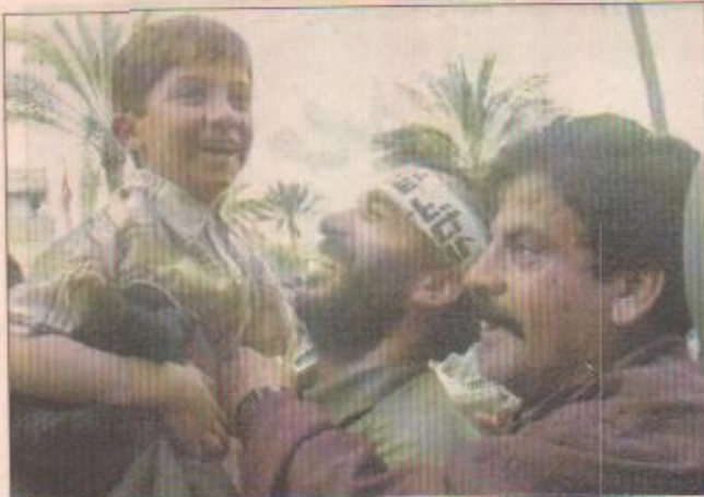
□ أحد المرحح عنهم... يحتضن ابنه