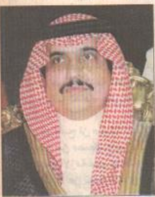
□ الأمير محمد بن فهد