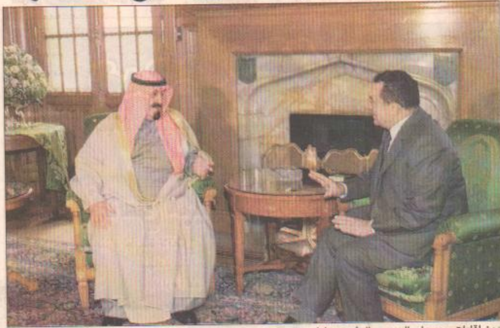
□ لقاءات سمو ولي العهد مع الرئيس مبارك

وقال مسؤول مصري - (اليوم) ان خطة عقد مؤتمر سلام في الشرق الاوسط ستكون على جدول المصادقات رغم عدم صدور اية موافقة عربية عليها حتى الآن.. في الوقت الذي اوضح فيه سمو وزير الخارجية الامير سعود الفيصل عدم مشاركة المملكة في اي مؤتمر دولي يستبعد