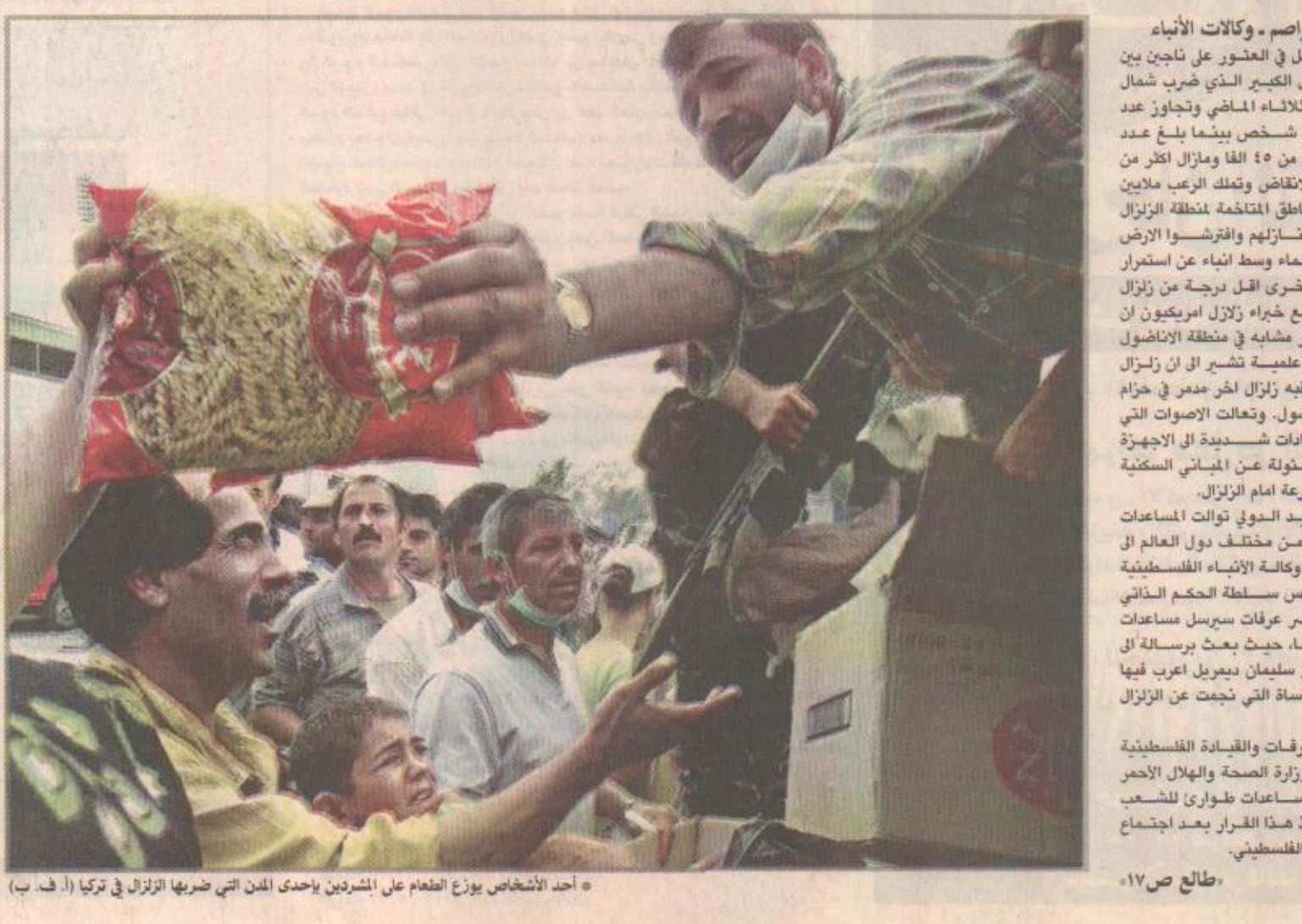
أحد الأشخاص يوزع الطعام على المشردين بأحدى المدن التي ضربها الزلزال في تركيا