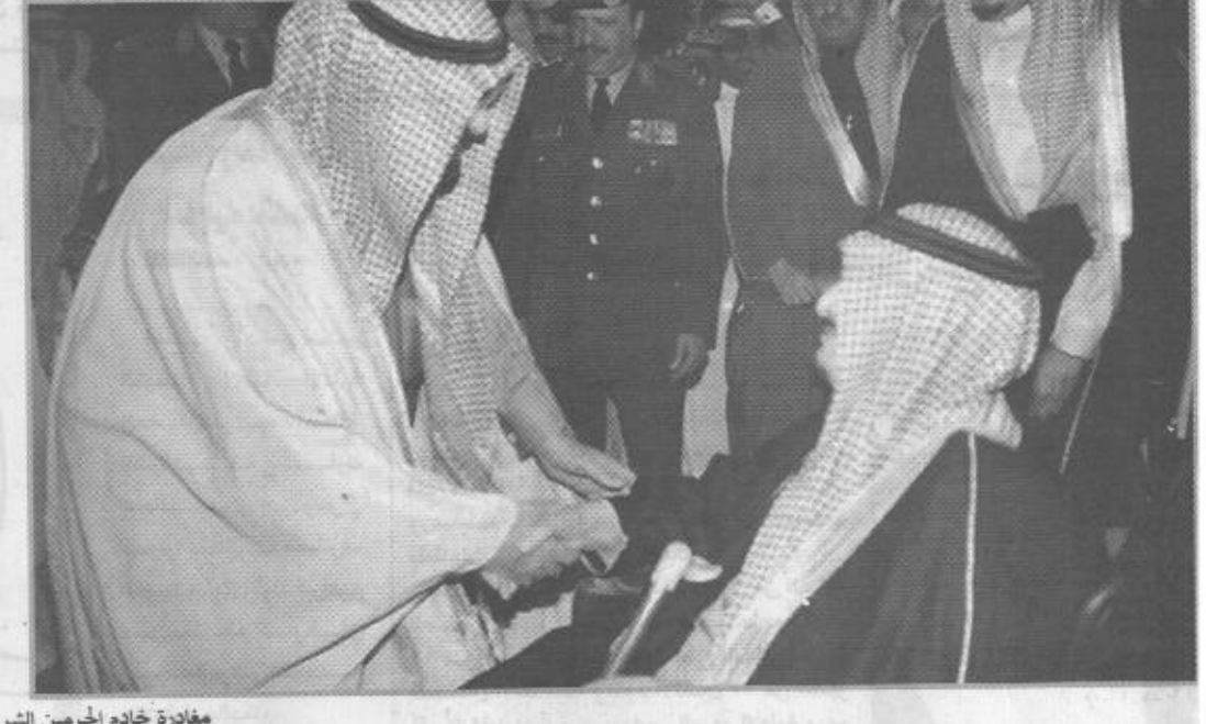
مغادرة خادم الحرمين الشريفين الرياض