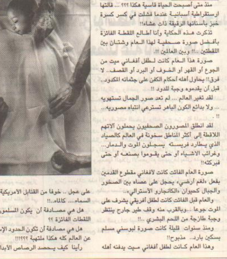
طفلة فلسطينية تولد بعد ساعات من استشهاد والدها

طهران / اليوم ذكرت مصادر بالمصاحبة الإيرانية طهران ان الاتصالات الدبلوماسية التي جرت لاحتواء تطور الموقف بين الحكومتين الأمريكية والإيرانية أثمرت عن وقف التصعيد بين البلدين ودخول الحكومة الأفغانية كطرف في العملية، ومن خلالها سيتم تعقب أعضاء تنظيم القاعدة الموجودين داخل إيران أو على الحدود بين البلدين. وكانت إيران وأفغانستان قد تعهدتا بفتح صفحة جديدة من علاقات الأخوة بينهما متجاهلتا الاتهامات الأمريكية لطهران بمحاولة تقويض السلام البشري في أفغانستان. وعن زيارة رئيس الحكومة الأفغانية المؤقتة حامد قرضاي فرصة بالنسبة للرئيس الإيراني محمد خاتمي لظهور شاييد إيران للادارة الجديدة في كابول وتأكيد دورها كجائزة كبيرة في إعادة إعمار أفغانستان. وقال قرضاي في مؤتمر صحفي (حضورنا إلى هنا كان تزداد ببيت خفيك لأن إيران دولة شقيقة لنا، إيران ليست جارة فحسب بل هي صديقة أيضا) ووصل قرضاي على رأس وفد كبير يضم ثمانية وزراء إلى طهران في زيارة تستغرق ثلاثة أيام ومن المقرر ان يعقد مزيدا من المحادثات مع خاتمي وغيره من كبار المسؤولين الإيرانيين.