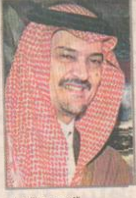
الأمير سعود الفيصل

بعقد اصحاب السمو والمعالي ووزراء الخارجية بدول مجلس التعاون لدول الخليج العربية بعد ظهر اليوم الجمعة اجتماعا تحضيريا للقمة العشرين لقادة دول المجلس وذلك في قصر البريعة بالرياض حيث سيضع الوزراء اللسان الاخيرة على جدول اعمال المؤتمر واعربت مصادر خليجية ل«اليوم» عن تفاعلها بصفة الرياض التي وصفتها بانها خطوة كبيرة ومنطقت مام في طريق التعاون الاقتصادي والسياسي دول المجلس حيث ارجع موضوع توحيد التعرفة الجمركية على رأس الملف الاقتصادي لجدول اعمال تمهيدا لقراره من قبل اصحاب الجلالة والسمو قادة دول المجلس. ومن المقرر ان يترأس صاحب السمو الملكي الأمير سعود الفيصل وزير الخارجية الاجتماع التحضيري كونه رئيس الدورة الجديدة للمجلس الوزاري لمجلس التعاون لدول الخليج العربية.