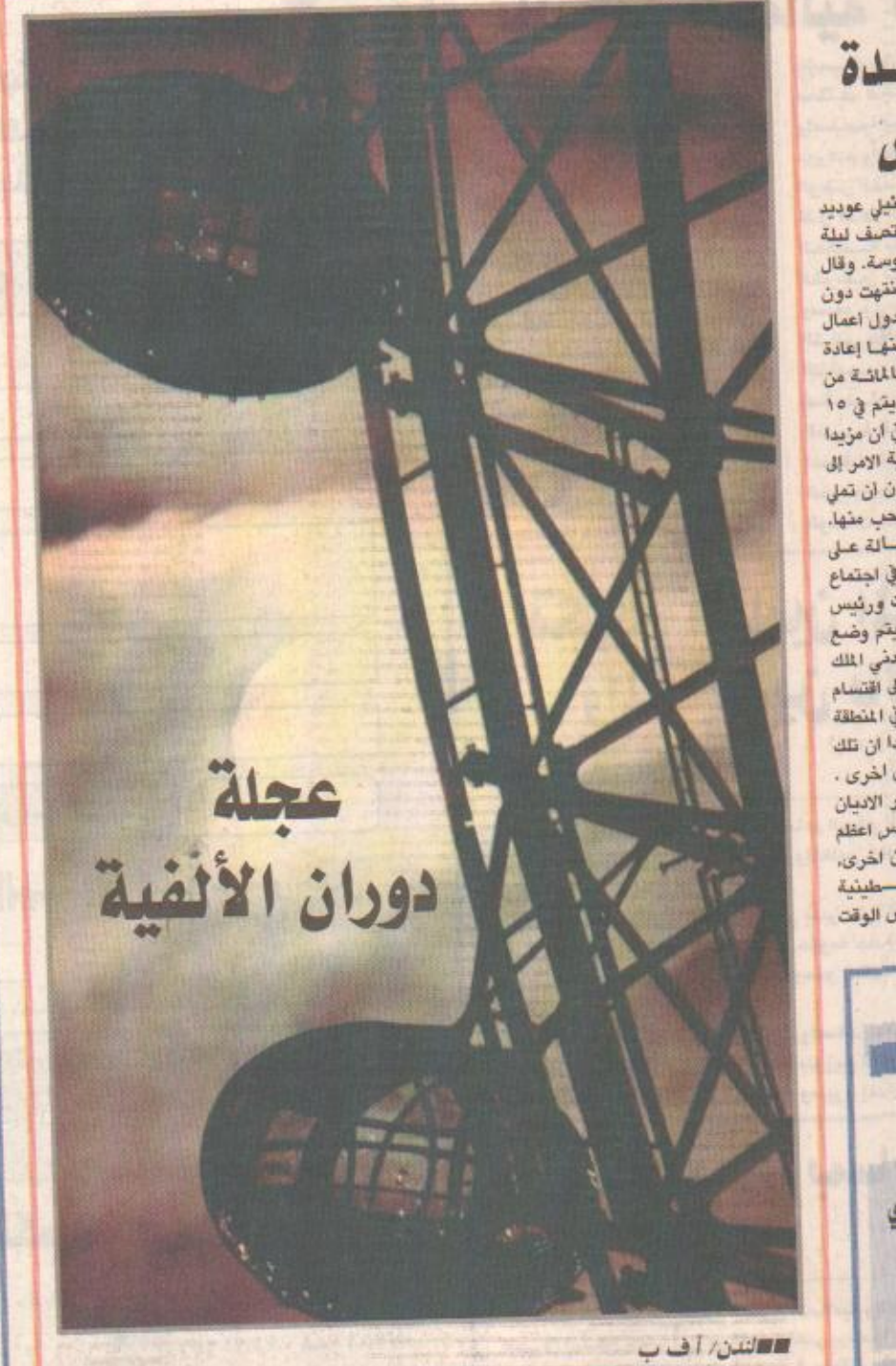
عجلة الانفوية الدوارة يظهر عليها اسم القمر ليلة 24 نوفمبر والمسماة عين لندن ستتحرك لمساح مساهمة العاصمة البريطانية بوضوح تام من على اكر عجلة دوارة لها 32 «ركابا» يتسع كل منها لخمس وعشرين راكبا ويوزن تسعة اطنان.