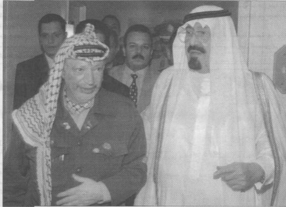
سمو ولي العهد .. دعم مستمر لفلسطين

٢٣٨ بما فيها القدس الشرقية عاصمة الدولة الفلسطينية. وقال الرئيس عرفات، أن التعامل مع المبادرة السعودية بهذا الحجم الكبير من ردود الفعل العالية والإيجابية يجعلها من أهم الأطروحات الدولية للخروج من هذا المأزق الذي يهدد المنطقة، ويعد عملية السلام التي مسارها الصحيح. وكان الرئيس عرفات قد التقى بخافيير سولانا قبل توجهه إلى إسرائيل لمناقشة المبادرة. وفي هذا الصدد، قال الرئيس عرفات، إن المبادرة العربية السعودية هي الأساس للانسحاب الإسرائيلي من كافة الأراضي العربية والفلسطينية التي احتلت في الرابع من يونيو ١٩٦٧ وتطبيق قرارات الشرعية الدولية ٢٤٢