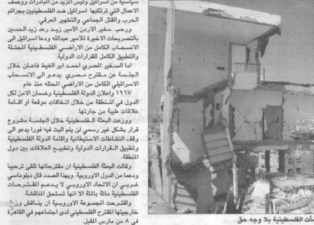
جانب من الدمار الذي تعرضت له المنشآت الفلسطينية بلا وجه حق

اجتمع سفراء دول مجلس الأمن الدولي على أن مبادرة صاحب السمو الملكي الامير عبد الله بن عبد العزيز ولي العهد نائب رئيس مجلس الوزراء رئيس الحرس الوطني بالتطبيع الكامل مع اسرائيل مقابل انسحابها من كامل الاراضي العربية فرصة لاكتشاف الطرق لحل الصراع العربي الإسرائيلي. وكره ترحيب السفراء خلال جلسة مجلس الأمن الدولية قبل الماضية الذي استأنف مناقشاته حول أعمال العنف في الاراضي الفلسطينية المحتلة وسط دعوات صادرة للاخذ بحين الاعتبار ودراسة مبادرة سمو ولي العهد حول التطبيع الكامل مع اسرائيل شرعية انسحابها من كامل الاراضي العربية والقدس الشرقية بهدف تسوية الصراع العربي الإسرائيلي. وعقد المجلس اجتماعه بناء على رغبة المجموعة العربية وجهتها الاسبوع الماضي من اجل تدارس الوضع المتدهور في الاراضي الفلسطينية واتخاذ الاجراء الالزامي من اجل وضع حد لاعمال العنف. وحذر سكرتير عام الامم المتحدة كوفي عنان خلال الجلسة الاولى لمجلس الأمن يوم الخميس الماضي من