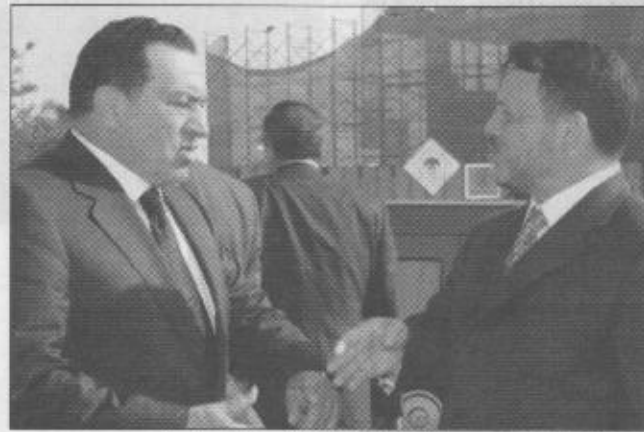
حديث بين الرئيس مبارك والعمال الاردني حول المبادرة

وصف الرئيس المصري حسني مبارك مبادرة صاحب السمو الملكي الامير عبدالله بن عبد العزيز ولي العهد نائب رئيس مجلس الوزراء رئيس الحرس الوطني بأنها طيبة ولكن المهم هو قيام اسرائيل بالانسحاب من جميع الاراضي التي احتلتها في حرب ١٩٦٧. وقال مبارك في حديث صحفي أن المشكلة الأساسية التي تواجه التحرك نحو السلام هي عدم وجود فكر سياسي لدى الحكومة الإسرائيلية الحالية برئاسة ارييل شارون. وأكد مبارك أن مباحثاته مع الرئيس الاميركي جورج بوش خلال زيارته لواشنطن التي تبدا السبت المقبل ستتركز حول دفع عملية السلام لصالح أمن واستقرار المنطقة. وكانت وكالة انباء الشرق الأوسط المصرية قد نقلت عن مصادر سياسية عريضة قولها أن مباحثات الرئيس