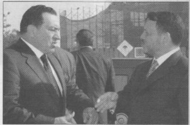
حديث بين الرئيس مبارك والعمال الاردني حول المبادرة

وصف الرئيس المصري حسني مبارك مبادرة صاحب السمو الملكي الامير عبدالله بن عبد العزيز ولي العهد نائب رئيس مجلس الوزراء رئيس الحرس الوطني بأنها طيبة ولكن المهم هو قيام إسرائيل بالانسحاب من جميع الاراضي التي احتلتها في حرب ١٩٦٧. وقال مبارك في حديث صحفي أن المشكلة الأساسية التي تواجه التحرك نحو السلام هي عدم وجود فكر سياسي لدى الحكومة الإسرائيلية الحالية برئاسة ارييل شارون. وأكد مبارك أن مباحثاته مع الرئيس الاميركي جورج بوش خلال زيارته لواشنطن التي تبدأ السبت المقبل ستتركز حول دفع عملية السلام لصالح أمن واستقرار المنطقة. وكانت وكالة أنباء الشرق الأوسط المصرية قد نقلت عن مصادر سياسية عريضة قولها أن مباحثات الرئيس