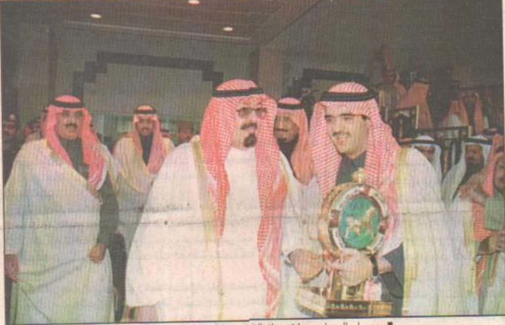
سمو ولي العهد لدى رعايته سباق الخيل على كأس خادم الحرمين الشريفين العهد مكانه في المنصة الرئيسية عزف السلام الملكي. وقد سلم صاحب السمو الملكي الأمير عبدالله بن عبدالعزيز كأس خادم الحرمين الشريفين لخيل الأنتاج

الرياض/ واس نيابة عن خادم الحرمين الشريفين الملك فهد بن عبدالعزيز حفظه الله رعى صاحب السمو الملكي الأمير عبدالله بن عبدالعزیز ولي العهد ونائب رئيس مجلس الوزراء ورئيس الحرس الوطني عصر امس حفل سباق الخيل على كأس خادم الحرمين الشريفين. ولدى وصول سموه الى ميدان السباق كان في استقباله صاحب السمو الملكي الأمير سلمان بن عبدالعزيز أمير منطقة الرياض عضو مجلس إدارة نادي الفروسية وصاحب السمو الأمير سلطان بن محمد بن سعود الكبير عضو مجلس إدارة نادي الفروسية وصاحب السمو الملكي الفريق ركن متعب بن عبدالله بن عبدالعزيز نائب رئيس الجهاز العسكري بالحرس الوطني وقائد كلية الملك خالد العسكرية ورئيس للجان الفنية بنادي الفروسية ومعالى الاستاذ ابراهيم بن عبدالرحمن الطاسان عضو مجلس إدارة نادي الفروسية وعضو اللجنة العليا بالنادي وأعضاء مجلس إدارة النادي ومدير عام نادي الفروسية. وبعد ان أخذ سمو ولي