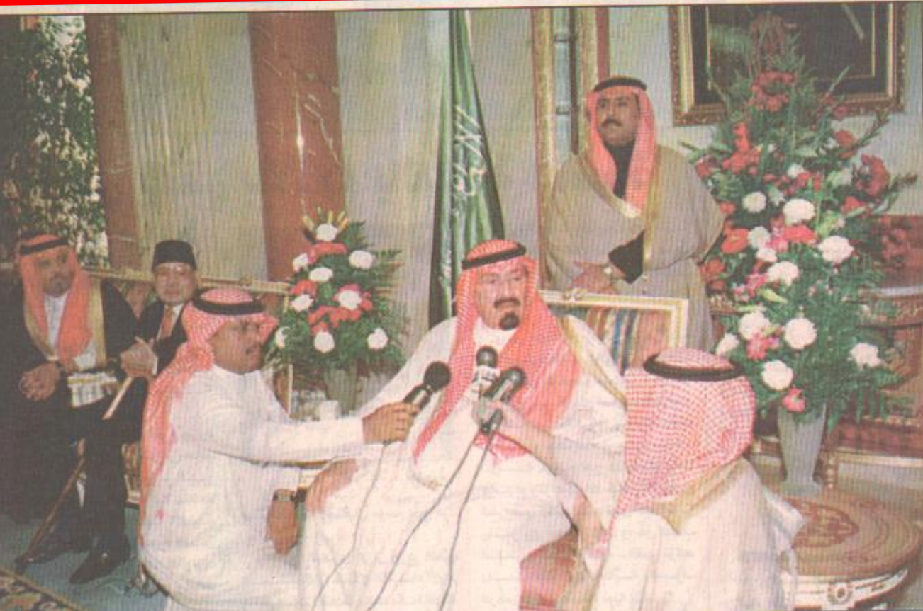
سمو ولي العهد يستقبل الادباء والمفكرين ويقدم حفل غداء تكريما لهم

البقية ص ٢٣، طالع كلمة (اليوم) ومشغلات الجنادرية.