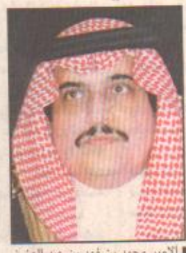
الأمير محمد بن فهد بن عبد العزيز

الدمام، عبدالله القشري يستقبل صاحب السمو الملكي الأمير محمد بن فهد بن عبدالعزيز آل سعود أمير المنطقة الشرقية بمكتب سموه بالممام بعد ظهر اليوم السفير التونسي بالمملكة.. الذي يزور المنطقة الشرقية حاليا ويلتقي بالجالية التونسية القيمة بالمنطقة الشرقية ويزور عدداً من المنشآت المختلفة.