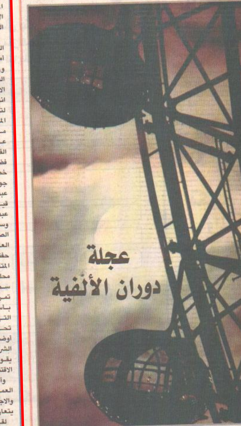
عجلة الانفوية الدوارة يظهر عليها اسم القمر ليلة 24 نوفمبر والمسماة عن لثمن ستتحل لمساح متساهدة العاصمة البريطانية بوضوح تام عن على اكر عجلة دوارة لها 32 «ركابا» يتسع كل منها لخمس وعشرين راكبا ويوزن تسعة اطنان.