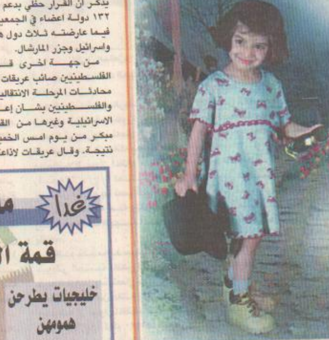
الرواد الصغار: تقدم الموسوعة معلومات جديدة عن الحياة وعالمها الغريب ومجموعة جديدة من اصدقاء «بستان المرح» واستطلاعاً عن الاطفال وعالم القراء.