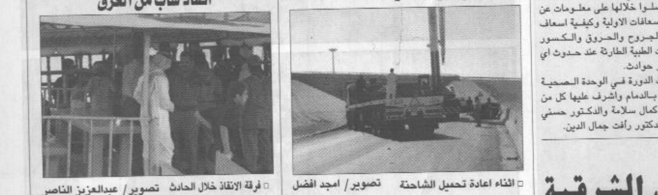
فرقة الانقاذ خلال الحادث

التقى عدد من مديري المستشفيات الحكومية والخاصة بالمنطقة والقطاعات الحكومية المعنية الاخرى في المنطقة في المديرية العامة للشؤون الصحية بالمنطقة الشرقية أمس مناقشة التنسيق والتعاون لمواجهة الكوارث والحوادث الطارئة. وناقش المجتمعون برئاسة مدير عام الشؤون الصحية بالمنطقة الشرقية الدكتور احمد بن عبدالله العلي ومشاركة الدفاع المدني ومستشفى قاعدة الملك عبدالعزيز الجوية بالطهران والهيئة الملكية بالجبيل والخدمات الطبية بارامكي السعودية والفرقة التجارية الصناعية بالعرض والفرقة الخاصة بالمنطقة والخدمات الصحية بالحرس الوطني ووزارة الداخلية بالمنطقة العديد من القضايا ذات الصلة والامان على جاهزة الجهات الصحية لاستقبال الحالات الطارئة ونقلها حسب القرب المكاني وتوفير الخدمات الصحية ووسائل النقل والاتصال. وتم تخصيص جدول زمني لعقد اجتماعات دورية لمناقشة وضع الخطط وتحديثها في جانب التجهيزات والامكانيات السريرية ومشاركة القطاعات الصحية المختلفة في حالة الازمات والطارئة.