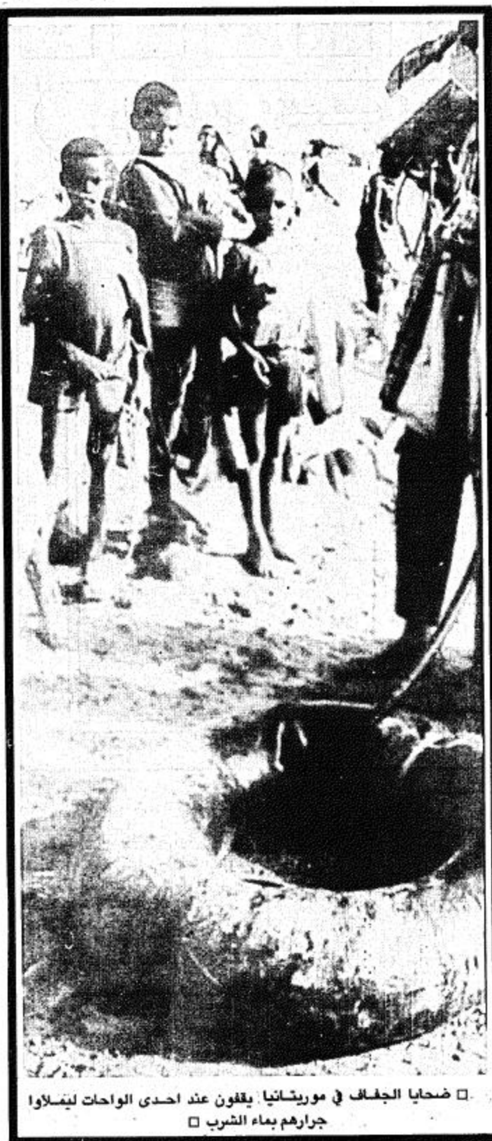
ضحايا الجفاف في موريشيا يقفون عند إحدى الواحات ليشابوا جرارهم بماء الشرب