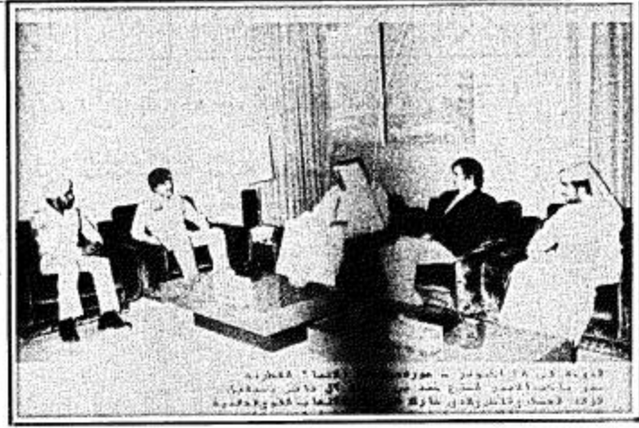
سمو ولي عهد قطر يستقبل الوفد العسكري الرياضي القطري