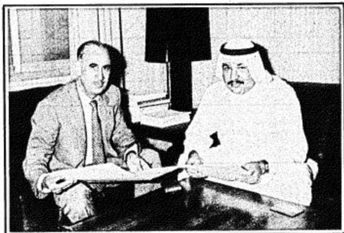
التوقيع على اتفاقية التعاون الاقتصادي بين قطر وباكستان