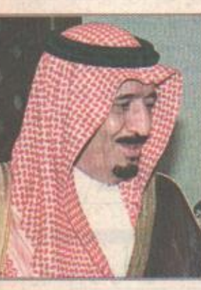
الأمير سلمان بن عبدالعزيز

عرب صاحب السمو الملكي الأمير سلمان بن عبدالعزيز أمير منطقة الرياض والمترشح العام على مكتبة الملك فهد الوطنية عن شكره وتقديره لسمو الشيخ جاسم بن سعود بن عبدالعزيز آل ثاني لثاني إثر تلقي المكتبة هدية سموه المتصلة في مجموعة من الوثائق التاريخية الأصلية والصور الفوتوغرافية القديمة التي تعد إضافة قيمة لمقتنيات المكتبة لما لها من صلة وثيقة بتاريخ المملكة والتي تؤكد العلاقات المتميزة بين قادة المملكة العربية السعودية وشقيقها دولة قطر. وتضم المجموعة سبع وثائق أصلية تغطي بعض جوانب الحياة الاجتماعية والاقتصادية في عهد الملك عبدالعزيز - طيب الله ثراه - منذ عام ١٣١٣هـ ولثلاث وستين صورة فوتوغرافية قديمة لقادة الدولتين من المسوك والإمام تبرز اللقاءات والزيارات التي تمت في مناسبات وفترات مختلفة خلال خمسين عاما تقريبا. «البقية ص ١٧»