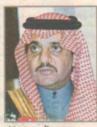
الأمير سعود بن نايف

يتقدم صاحب السمو الملكي الأمير سعود بن نايف بن عبدالعزيز آل سعود نائب أمير المنطقة الشرقية جموع المصلين لصلاة الاستسقاء التي ستقام بجامع خادم الحرمين الشريفين بالدمام. وذلك في الساعة السادسة والنصف من صباح اليوم الاثنين وسيؤم المصلين فضيلة الشيخ محمد بن زيد آل سليمان رئيس المحاكم الشرعية بالمنطقة الشرقية وقد قامت وزارة الشؤون الإسلامية والدعوة والإرشاد بالمنطقة الشرقية وأمانة مدينة الدمام بتجهيز المصلين والجموع والمساجد التي تم اعتمادها بالاحتياجات اللازمة. «البقية ص ١٧»