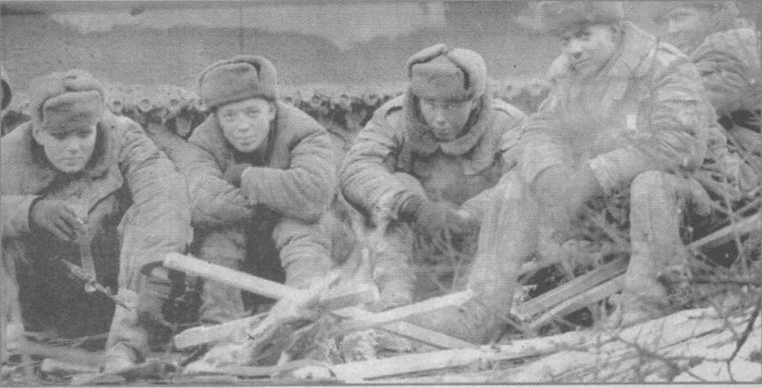
جنود روس يستدفون من البرد ويعانون مستغ الحرب في الشيشان

وفي هذه الأثناء أكد الرئيس الروسي فلاديمير بوتين عزمه وقف العمليات الحربية الواصلة في نطاق شمال القوقاز فور أن يتم الاستيلاء على العاصمة الشيشانية جروزني والاعلان الرسمي عن الاطاحة بالقيادة الشيشانية الشرعية