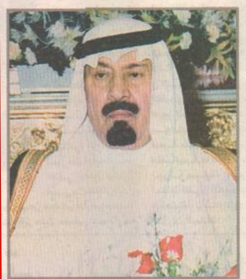
الأمير سلطان بن سلمان

وجه صاحب السمو الملكي الأمير عبدالله بن عبدالعزيز ولي العهد ونائب رئيس مجلس الوزراء ورئيس الحرس الوطني ينقل الطفلتين السودانييتين السياميتين من مستشفى الملك خالد بتيوك إلى مستشفى الملك فهد للحرس الوطني بالرياض لإجراء عمل ما تحتاجه حالة الطفلتين من عمليات جراحية وعلاج. وكانت امرأة سودانية قد أنجبت قبل أيام في مستشفى الولادة والإنفاط بتيوك طفلتين سياميتين لهما ثلاث أرجل وطرفان علويان وتعاينان من التصاق في جزء من الصدر وظل البطن ولهما حبل سري واحد. «البقية ص ١٧»