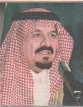
الأمير سلطان بن سلمان

رئيس جامعة بولونيا: المركز مؤسسة بحثية لدراسة الشريعة الإسلامية إيطاليا والتي تبرع سموه بإنشائه بعد أن تلقى طلبا من الجامعة بدعم إنشاء المركز. وذكرت قيادات إسلامية في تصريحات لـ اليوم أن هذا المركز يمثل امتدادا للعطاء السعودي المتواصل للأقليات الإسلامية في جميع أنحاء العالم، وأوضحت أنه ينطلق من دور المملكة القيادي والراشد في دعم العمل الإسلامي بجامعة بولونيا بجمهورية «البقية ص ١٧»