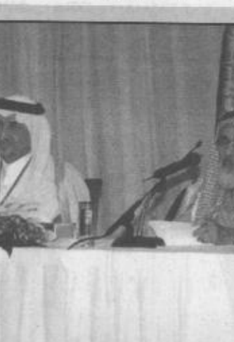
الامير خالد الفيصل يرحب بأحد الفائزين