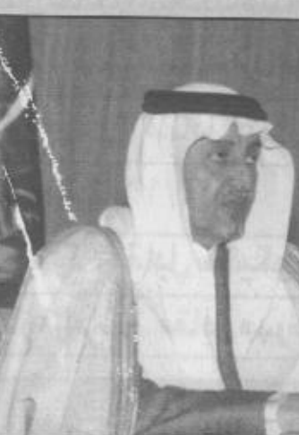
سمو أمير منطقة عسير يعلن أسماء الفائزين