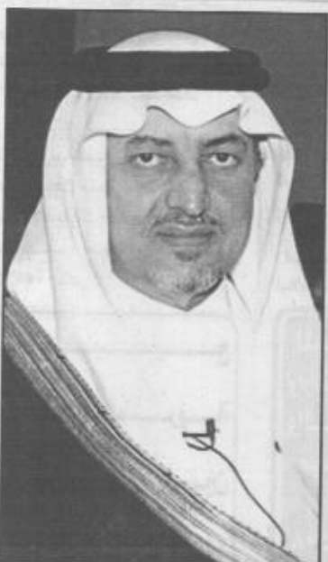
■ الامير خالد الفيصل

الرياض/ منصور العمري نيابة عن خادم الحرمين الشريفين الملك فهد بن عبدالعزيز (يحفظه الله) يرعى صاحب السمو الملكي الامير عبد الله بن عبد العزيز ولي العهد نائب رئيس مجلس الوزراء رئيس الحرس الوطني مساء اليوم الجمعة حفل جائزة الملك فيصل العالمية، والتي منحت لعدد من الشخصيات المتعمرة على مستوى العالم، وسوف يقوم سمو ولي العهد بتوزيع الجوائز على الفائزين. ذكر ذلك صاحب السمو الملكي الامير خالد الفيصل بن عبد العزيز امير منطقة عسير المدير العام لمؤسسة الملك فيصل الخيرية رئيس هيئة جائزة الملك فيصل العالمية. وكانت المؤسسة أعلنت في شهر رمضان الماضي اسماء الفائزين بجائزة الملك فيصل العالمية، حيث فازت الهيئة العليا لجمع التبرعات لمسلمي البوسنة والهرسك من المملكة، والتي يرأسها صاحب السمو الملكي