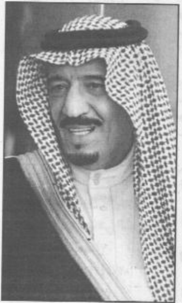
■ سمو الامير سلمان بن عبدالعزيز