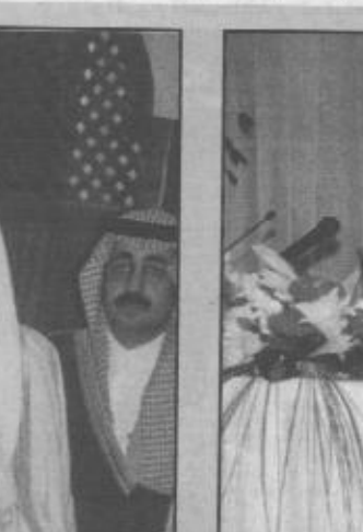
ثناء حفل اعلان الاسماء