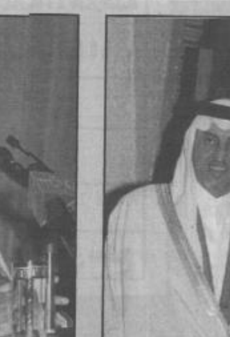
الامير خالد الفيصل يري حواره امير سعود بن خالد بن امير السعدي