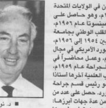
د. نورمان شوماوي

هيئة جراحى الصدر في أمريكا. تولى عضوية وعمل مستشاراً للعديد من اللجان والمطبوعات العلمية الصادرة في أمريكا وأوروبا وأفريقيا وآسيا المختصة بعلوم الجراحة وزراعة الأعضاء والأنسجة وابتحاح المناقشة الثانية والكبد وامراض وزراعة الكلى ومباحث الأورام. نال أكثر من ٤٠ جائزة دولية على إنجازاته العلمية ومساهماته الكبيرة في علاج امراض الكبد وجراحة وزراعة الكلى، وعلى مساهماته في تطوير الطب السريري وابتحاح الدم داخل بلاده الولايات المتحدة الأمريكية، ومن مختلف الدول والمؤسسات العلمية المعروفة في مناطق مختلفة من العالم.