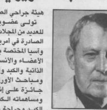
د. توماس استارزل

ولد في مدينة لي بولاية ايوا الأمريكية في ١١ مارس ١٩٢٦م، وهو متزوج وله ٣ أبناء. حصل على شهادة الماجستير في كلية ويستمنستر عام ١٩٤٧م، تخصص آجيا، وحصل على الماجستير في عام ١٩٥٠م، في علم التشريح والدكتوراة في نفس الجامعة. عمل في العديد من الجامعات والمستشفيات الأمريكية استاذاً للجراحة ورئيساً لاقسام الجراحة في عدد من الكليات، وجراسا مقبما في العديد من المستشفيات العامة والجامعية. في عام ١٩٥٨م حصل على إجازة هيئة الجراحين الأمريكيين. وفي شهر أكتوبر من العام التالي حصل على إجازة