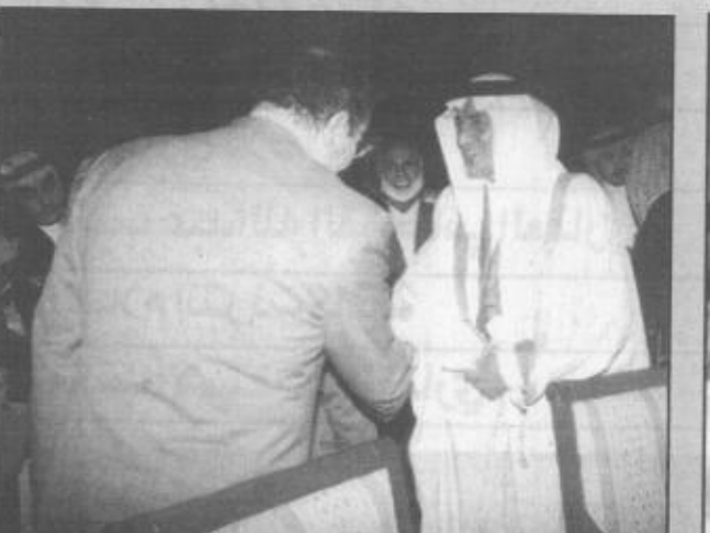
الامير خالد الفيصل يرحب بأحد الفائزين

حصل على شهادة الدكتوراة في الفيزياء النظرية في جامعة هارفارد أكتوبر ١٩٨٤م، ويعمل منذ عام ١٩٩٢م استاذاً في جامعة اوناريو شعبة الفيزياء، وسبق له ان عمل في جامعات برينستون وبمسلفانيا وهارفرد، كما عمل مستشاراً وابتاحاً وفاد مشاريع بحثية في العديد من معامل ومراكز الأبحاث ولتقدم في مجال التطبيقات الفيزيائية، وكذلك قاد العديد من المشاريع البحثية المتعلقة بالفيزياء الفلكية والموجات الصوتية وحصل على عدة جوائز من الولايات المتحدة وكندا واليابان.