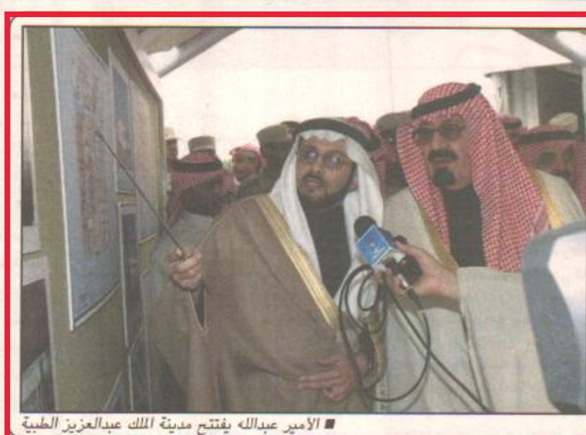
الأمير عبدالله يفتتح مدينة الملك عبدالعزيز الطبية

اليوم/خاص من المتوقع ان تشهد الهياكل الادارية والوحدات الداخلية للفرع التجارية الصناعية بالملكة تطويراً كبيراً خلال المرحلة المقبلة. وعلمت «اليوم» ان هذا التطوير جاء نتيجة لمناقشات مستفيضة خلال المنتدى الثاني للفرع التجارية الذي استضافته الغرفة التجارية الصناعية بالشرقية وأبدي خلاله العديد من الملاحظات التي تركزت حول مدى تنفيذ توصيات المنتدى الأول للفرع والذي عقد منذ سنتين. وان هذا التطوير لم يكن على مستوى التطورات العرضية مع ضرورة ايجاد آلية عمل لتنفيذ توصيات المنتدى.. وكيفية متابعة هذه التوصيات.