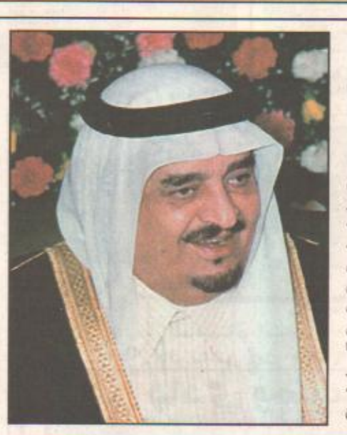
الأمير نايف يقف على جهود حشد الطاقات والإمكانات لخدمة ضيوف الرحمن

ولي العهد رعى حفل الافتتاح: مدينة الملك عبدالعزيز الطبية حلقة من الانجازات الرياض / عبدالله الحميد وعلي الزهراني أكد صاحب السمو الملكي الأمير عبدالله بن عبدالعزيز ولي العهد نائب رئيس مجلس الوزراء رئيس الحرس الوطني أن مدينة الملك عبدالعزيز الطبية تمثل صرحاً طبياً رائداً مشيراً سموه الى انه ليس سوى حلقة في سلسلة طويلة من الانجازات ومكتسبات حقلها هذا الوطن بفضل الله وتوفيقه لم بقيادة أخي خادم الحرمين الشريفين يرعاه الله ويسواعد المختصين من أبناء هذا الوطن وبإتانه الذين يمثل مشيرو الشؤون الصحية بالحرس الوطني نموذجاً مضميناً لهم لتأهيلهم العلمي الرفيع وعظائم الخلق الذي نرجو منه المزيد خدمة لدينتهم ووطنهم وأهلهم. جاء ذلك خلال افتتاح سموه للمدينة أمس.