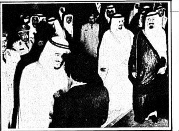
ثلاثة مشاهد من وصول الرئيس اليمني علي عبدالله صالح واستقبال جلالة الملك له في مطار الملك خالد