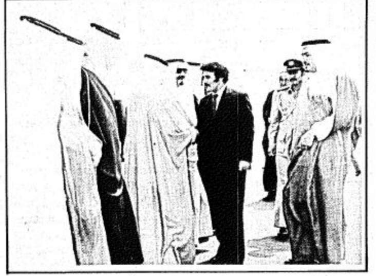
ثلاثة مشاهد من وصول الرئيس اليمني علي عبدالله صالح واستقبال جلالة الملك له في مطار الملك خالد