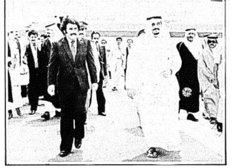
ثلاثة مشاهد من وصول الرئيس اليمني علي عبدالله صالح واستقبال جلالة الملك له في مطار الملك خالد