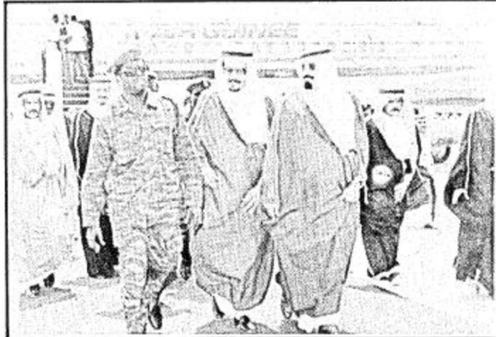
□ اربع لغات من وصول رئيس وزراء غينيا للرياض □