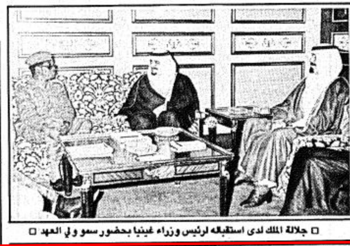
جلالة الملك لدى استقباله لرئيس وزراء غينيا بحضور سمو ولي العهد

الرياض - واس - استقبل جلالة الملك فهد بن عبد العزيز المفدى رئيس وزراء غينيا جارا تراوري برافقه وزير الخارجية ناسيني توري وحضر المقابلة صاحب السمو الملكي الامير عبد الله بن عبد العزيز وولي العهد وثالث رئيس مجلس الوزراء ورئيس الحرس الوطني وصاحب السمو الملكي الامير سلمان بن عبد العزيز أمير منطقة الرياض وصاحب السمو الملكي الامير سعود الفيصل وزير الخارجية كما حضرها السفير الغيني لدى المملكة محمد صالح. هذا وكان رئيس وزراء غينيا الكولونيل جاراتراوري قد وصل الى الرياض بعد ظهر امس.