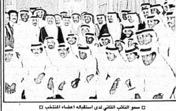
سمو النائب الثاني لدى استقباله لاعضاء المنتخب

استقبل صاحب السمو الملكي الامير عبد الله بن عبد العزيز وولي العهد وثالث رئيس مجلس الوزراء ورئيس الحرس الوطني سمو ولي العهد والنائب الثاني لمرافقه أعضاء المنتخب السعودي لكرة القدم والجهاز الاداري والفني.