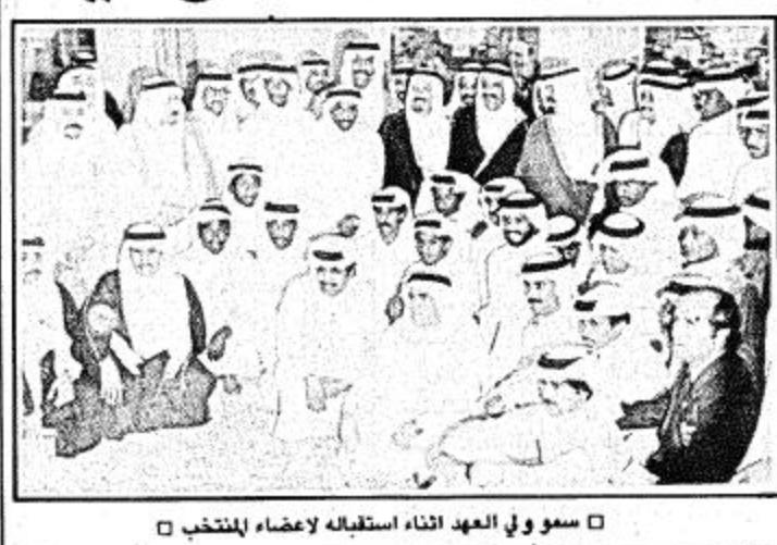
سمو ولي العهد أثناء استقباله لاعضاء المنتخب