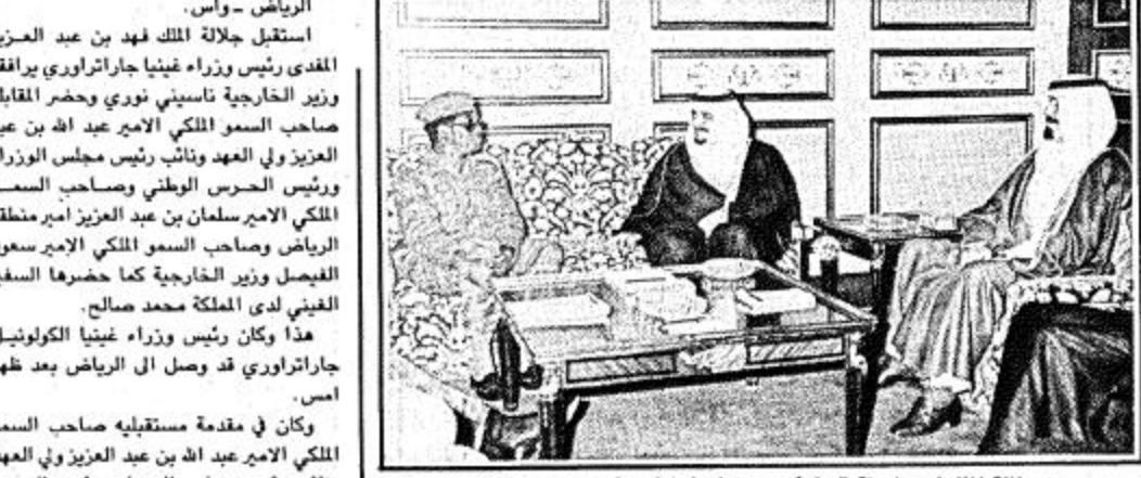
جلالة الملك لدى استقباله لرئيس وزراء غينيا بحضور سمو ولي العهد