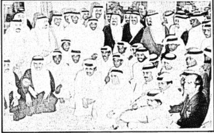
سمو ولي العهد أثناء استقباله لاعبي المنتخب