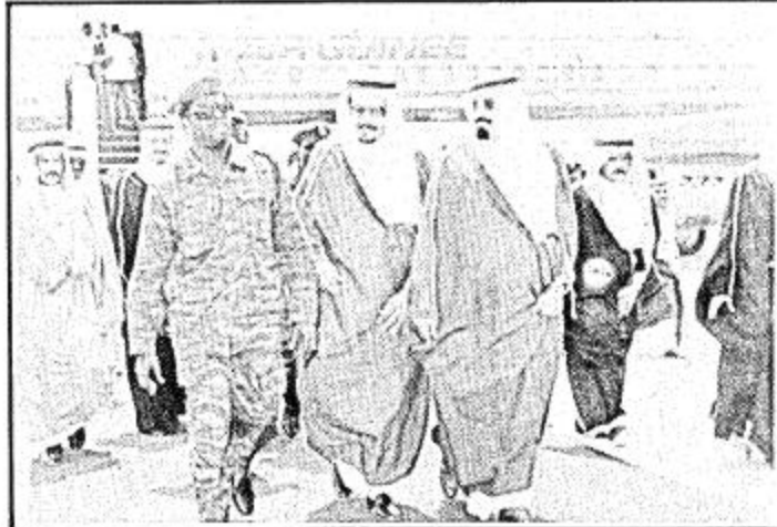
اربع لقطات من وصول رئيس وزراء عُينيا للرياض