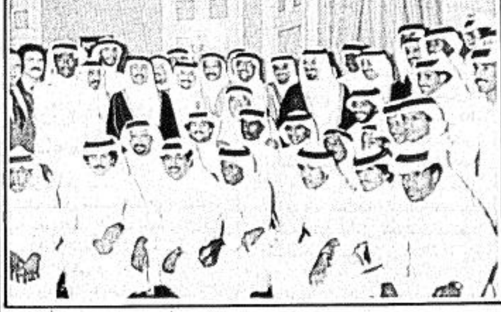
سمو النائب الثاني لدى استقباله لاعبي المنتخب

استقبل صاحب السمو الملكي الأمير عبد الله بن عبد العزيز ولي العهد نائب رئيس مجلس الوزراء ورئيس اللجنة الأولمبية مساء أمس منتخب المملكة لكرة القدم برفقة أعضاء الاتحاد السعودي لكرة القدم والجهاز الإداري والفني. وقد أعرب سمو الأمير عبد الله بن عبد العزيز عن سعادته لما حققوه من نتائج خلال التصفيات الأخيرة التي أقيمت في سنغافورة. ودعاهم إلى تحقيق المزيد لرفع اسم المملكة عالياً في المحافل الدولية. وقال سموه أن الروح التي لعب بها الفريق خلال المباريات أعطتهم الثقة في أنفسهم ومكثتهم من تقديم أفضل النتائج. وأضاف سموه أن التصرف بالعقيدة الإسلامية والتحلي بالصبر والمثابرة ستزيد من انتصاراتهم وتقدمهم. وأكّد سمو الأمير عبد الله أن توجيهات جلالة الملك المفدى لكم في التبراس الذي ما أن تستمكتم به فانكم ستكونون خرمين يمثل المملكة وتحققون كل ما تصبون إليه. كما استقبل صاحب السمو الملكي الأمير سلطان بن عبد العزيز نائب رئيس مجلس الوزراء ووزير الدفاع والطيران والمفتاحين (البلقية على ص ٣٠)