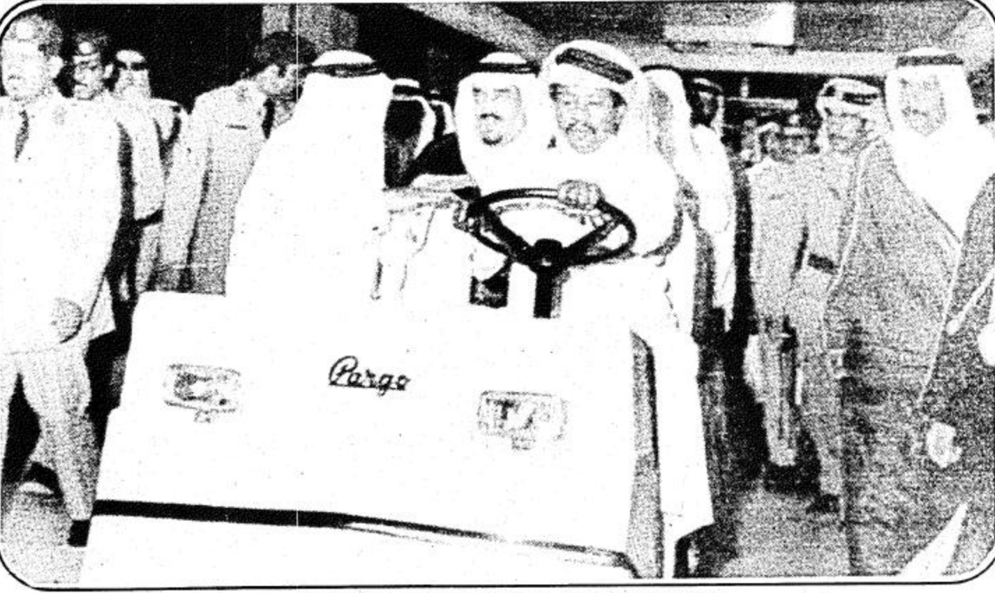
□ جلالة القائد يستمع الى شرح اثناء تجواله الميداني في مرافق المستشفى □

هذا كما القى سعادة السفير البريطاني لدى المملكة كلمة بمناسبة افتتاح المستشفى اشار فيها الى التعاون بين المملكة وبريطانيا وانه يعود الى تاريخ طويل وله سوابق عديدة ويكفي ان اذكر اسم المغفور له الملك عبد العزيز الذي كان من اعز اصدقاء البريطانيين، فلذلك اهم جانب من جوانب هذا المشروع الفاضل بالنسبة الى هو الفرص التي تتوفر منه لتجديد التعاون السعودي - البريطاني وتمديده وتوسيعه، وفي نهاية كلمته قدم التهنئة الى الحرس الوطني وقائده على افتتاح هذا المستشفى كما قدم التهنئة الى قائد المملكة وشعبها واختتم كلمته بقوله: