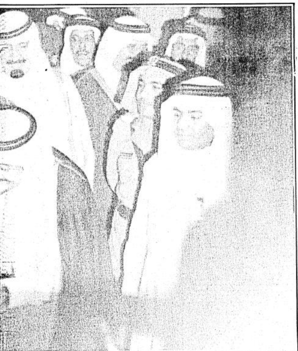
□ جلالة القائد يقبل تلميحاً

تطوير الخدمات الطبية السعودية في اتفاقية البرية