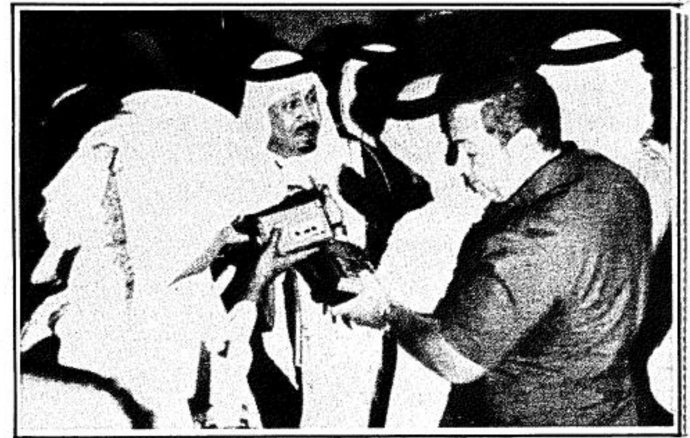
الامير بدر مع الصحفيين

الملك الامير بدر بن عبد العزيز نائب رئيس الحرس الوطني بتصريح قال فيه.. (بتوجيهات جلاله الملك المعظم ومتابعة سمو ولي عهده الامين فان الحرس الوطني يخطو خطا