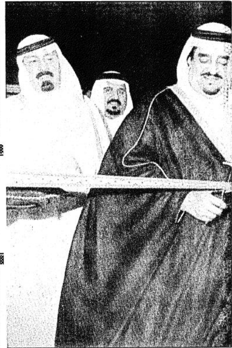
بيدانا بفتح الصرح الكبير