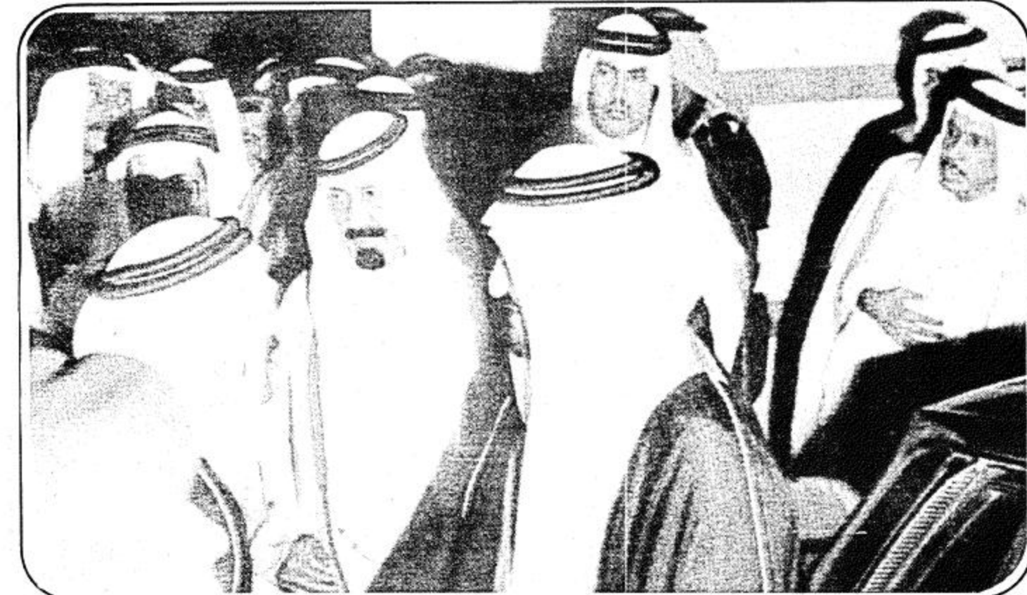
جلالة العهد وسمو ولي عهده الامين واستقبال للطام الطبي الوطني بالمستشفى