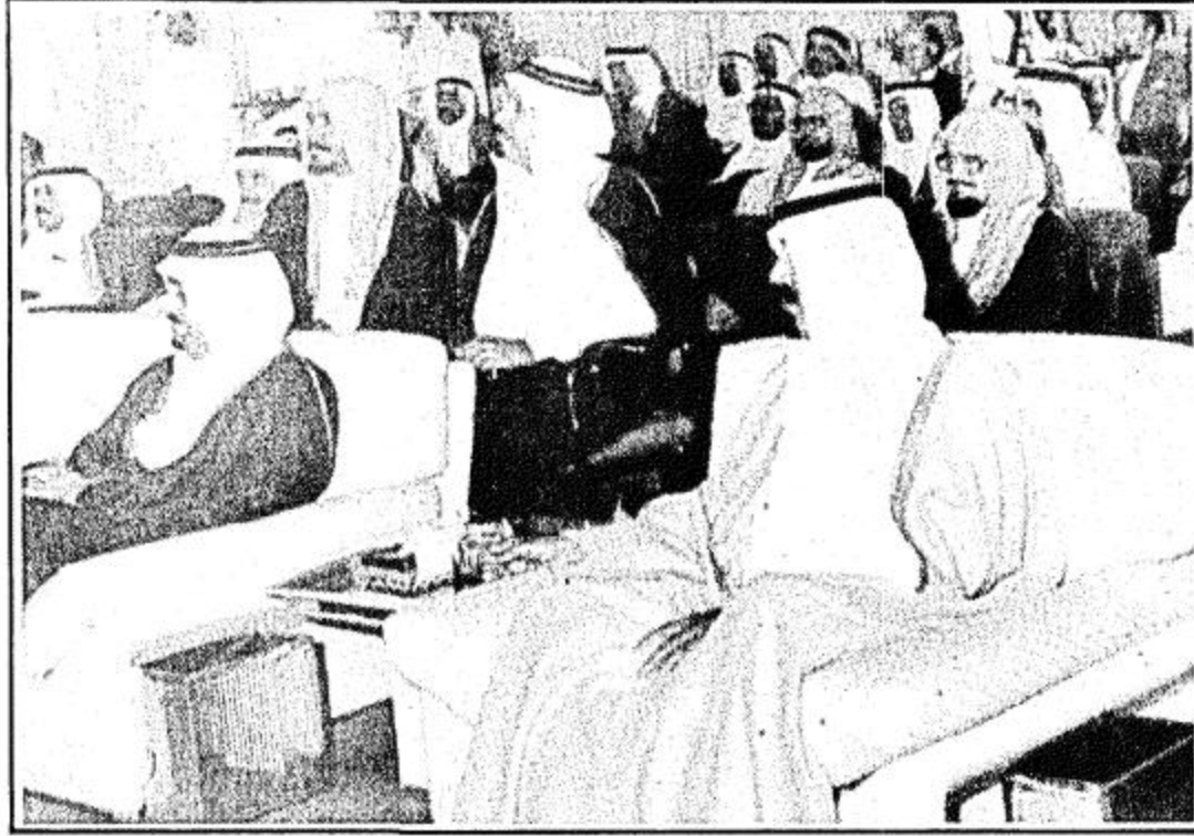
الملك فهد والامير عبدالله يتصدران الحضور

بن عبدالله: تدريب الكوادر الحرس مع الحكومة بانية..