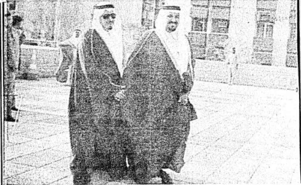
□ لحظة باسمه لأميرين سلطان ويدر □

كأين سينا والبيروني والرازي.. التصريحات وبعد انتهاء الحفل صرح صاحب السمو