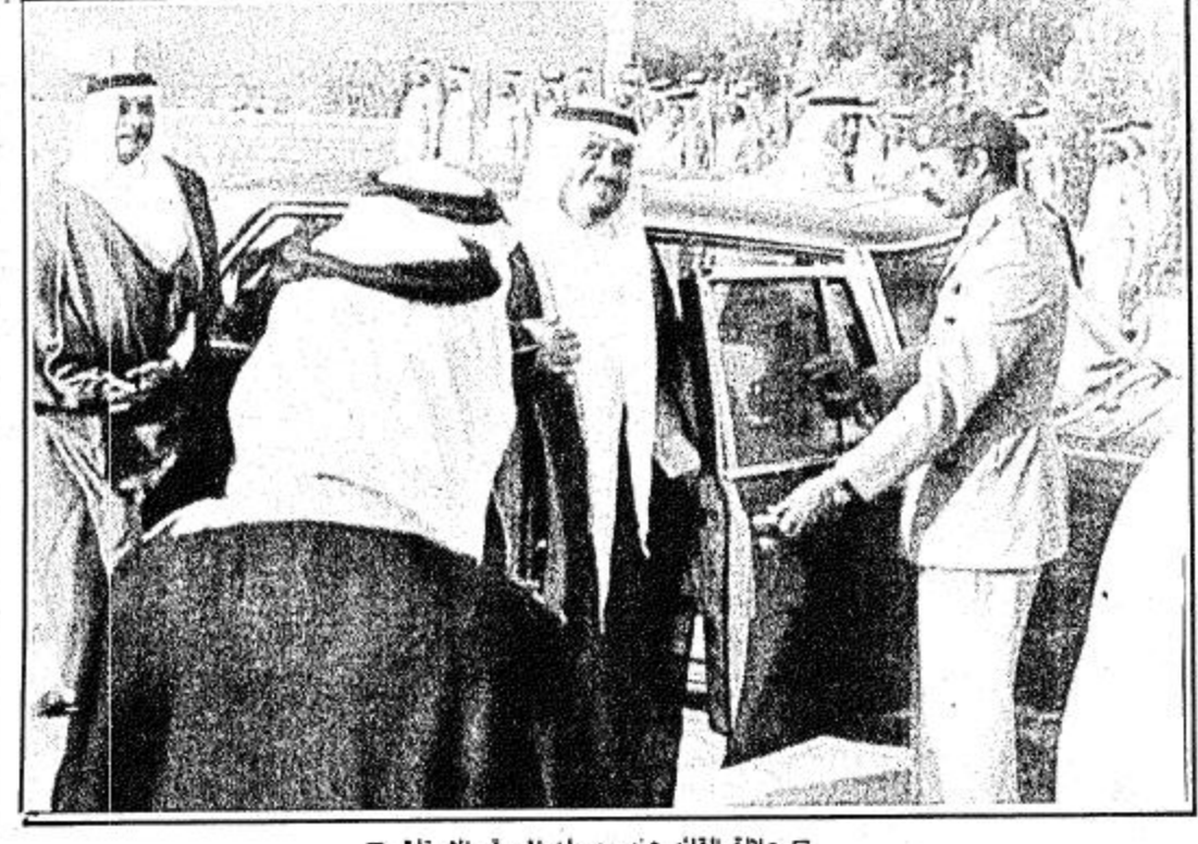
□ جلالة القائد عند وصوله الى مقر الاحتفال □

تطوير الخدمات الطبية السعودية في اتفاقية البرية