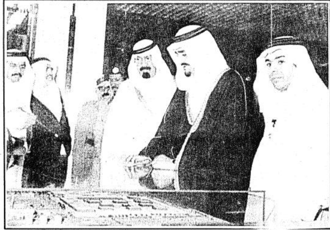
جلالة العهد وسمو ولي عهده الامين يستمعان الى شرح عن مجسم للمستشفى