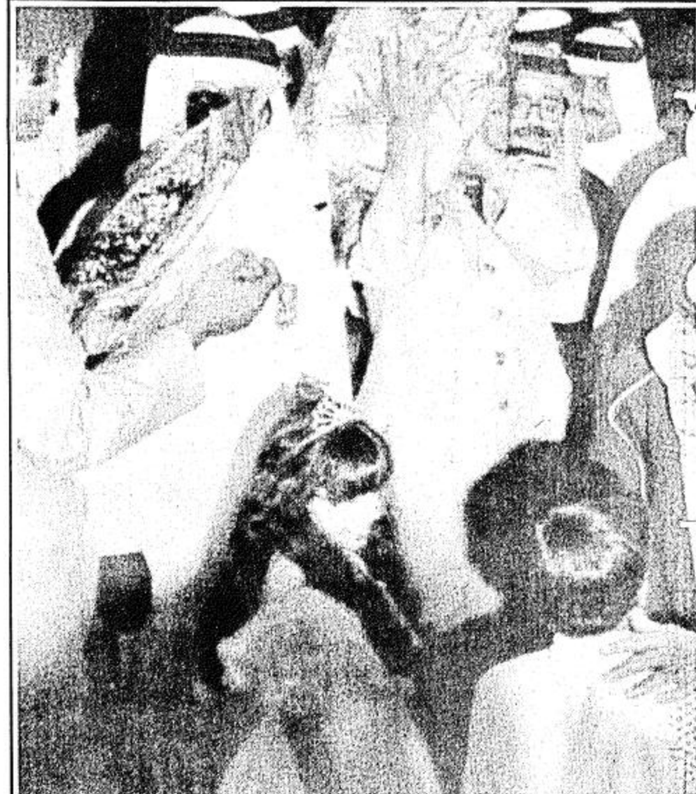
سلام بياقات الزهور

وفي نهاية تصريحه عبر سمو عن مشاعره وقال لا شك ان اي مواطن يشاهد هذه المشاريع التي تنشأ في بلده على احدث ما وصل اليه العلم