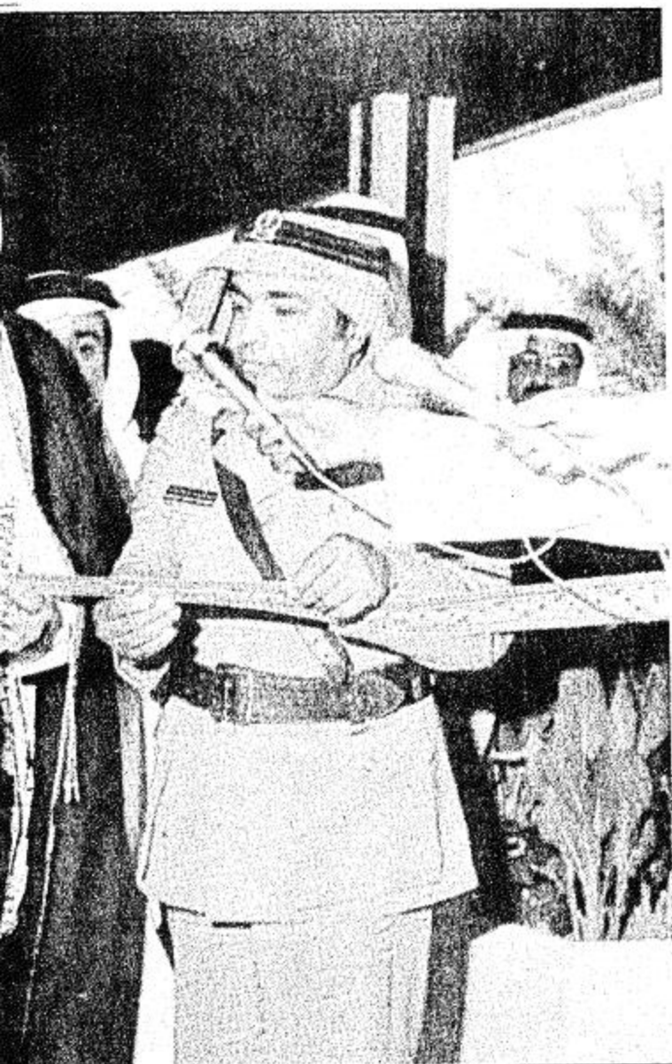
□ جلالة القائد يفتتح مستشفى الملك خالد في جدة