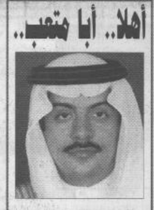
أهلا.. أبا متعب..

نجا به بوحدة الكلمة والتحام الصف ورفع شعار التوحيد. ان التردد بالرأي والعمل القاصر مرفوض بل نعمل سويا كل حسب قدرته وقدراته وكل حسب مسؤولياته نستعمل حسرات السيد ونشكر العمل المخلص. لا قبسول ولا استجابة ولا مهادنة لمن قد مصاحته الشخصية على مصلحة الوطن والشعب - بمعنى اننا سنحارب الزبوة والفساد وسوء التنفيذ وتعطيل المصالح وتقول: انه لا مكان لله -أبناء- بيننا بل نشد سن أن كل من يعمل من أجل مصلحة الوطن ورفي الشعب وسنقف معه ونبتني أراه. التأكيد على الدور الكبير والهام للمرأة ومكانتها العالية والغالية في نفوسنا فهي الأم التي ان اعدتها أعدت شعبا طيب الأعراق: وهي الأخر والبيت وهي التي تلعب الدور الرئيسي في عظمة الرجال والامم فورا كل رجل عظيم امرأة. ورفض تهمة دورها بل إبراز دورها وعملها في تنمية قدرات الوطن فهي المرعبة والطيبة والعلمية والعاملة في شتى الميادين والرعاية للأسرة. لا ولن نسمح بان يقال اننا نحاب المرأة كما يصفنا من لا يعرفنا بل نعرف مكانتها التي حافظها لها الدين الاسلامي ونعطيلها بنساء ونشكر كل دورها لها من التسهيلات ما يجعلها أكثر قدرة على لعب دورها كاملا في بناء مجتمعا. انه حشر للمنطقة للثقاه وسامعه ومعرفة على يدور بخواتمهم والعمل على تلبية رغباتهم فأن تسمع - ويد تبني