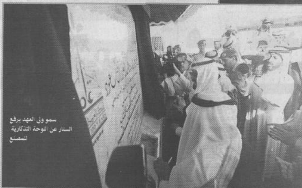
سو ولي العهد يرفع الستار عن اللوحة التذكارية للمصنع