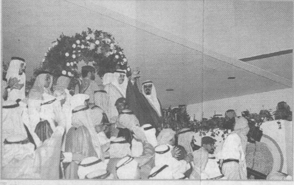
حيا بحب ووفاء بوفاء

الأحساء / عادل الذكر الله / فرحان العقيل رعى صاحب السمو الملكي الأمير عبدالله بن عبدالعزيز ولي العهد ونائب رئيس مجلس الوزراء ورئيس الحرس الوطني ظهر أمس حفل وضع حجر الأساس لمصنع الأقمشة إحدى شركات الأحساء للتنمية لإنتاج أقمشة الثياب والعباءات بطاقة إنتاجية تبلغ عشرة ملايين ياردة سنوياً وبتكلفة إجمالية تقدر بمائة وستين مليون ريال. وخلال مرور موكب سمو ولي العهد في شوارع محافظة الأحساء التي ارتابت بالأفلاك واللوحات الترحيبية خرجت جموع المواطنين وطالبة المدارس لاستقبال سمو ولي العهد حيث اصطفا على جانبي الطريق ملوحين بالإعلام السعودية وحاملين صور خادم الحرمين الشريفين الملك فهد بن عبدالعزيز وسمو ولي العهد الأمين وسمو النائب الثاني - حفظهم الله - ولدى وصول الموكب المقل لسموه مقر المشروع في المدينة الصناعية بمحافظة الأحساء كان في استقباله صاحب السمو الملكي الأمير محمد بن فهد بن عبدالعزيز أمير المنطقة وصاحب السمو الملكي الأمير سعود بن نايف بن عبدالعزيز نائب أمير المنطقة الشرقية وسمو الأمير بدر بن عبدالله بن جلوي محافظ محافظة الأحساء ومعالي وزير الصناعة والكهرباء الدكتور هاشم بن عبدالله يماني. اثر ذلك قدم طفل وطفلة باقتي ورد لسمو ولي العهد ثم عزف السلام الملكي. بعد ذلك تشرف أعضاء شركة الأحساء للتنمية والمخالفون المتحدون للمشروع بالسلام على سمو ولي العهد ويعد أن أخذ سموه مكانته في الحفل بدأ الحفل الخطابي بالقرآن الكريم.