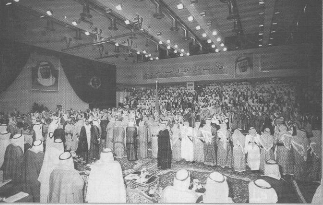
الجميع يردد الأهازيج في حب الوطن

سمو ولي العهد يستقبل جموعاً من المواطنين الأحساء / عادل الذكر الله / فرحان العقيل استقبل صاحب السمو الملكي الأمير عبدالله بن عبدالعزيز ولي العهد ونائب رئيس مجلس الوزراء ورئيس الحرس الوطني مساء أمس في قصر حجر الأحساء جموعاً من المواطنين الذين قدموا للسلام على سموه وتهنئته بسلامة الوصول . وفي بداية الاستقبال تلقت آيات من القرآن الكريم مع شرحها مما أضفى على هذا الاستقبال جواً من الروحية حيث عم الحضور مشاعر الطمأنينة والسرور وآيات الذكر الحكيم وتفسيرها . وحضر الاستقبال اصحاب السمو الملكي الامراء واصحاب الفضيلة العلماء واصحاب المعالي الوزراء وكبار المسؤولين من مدنيين وعسكريين . وقد تناول الجميع طعام العشاء على مائدة سمو ولي العهد.