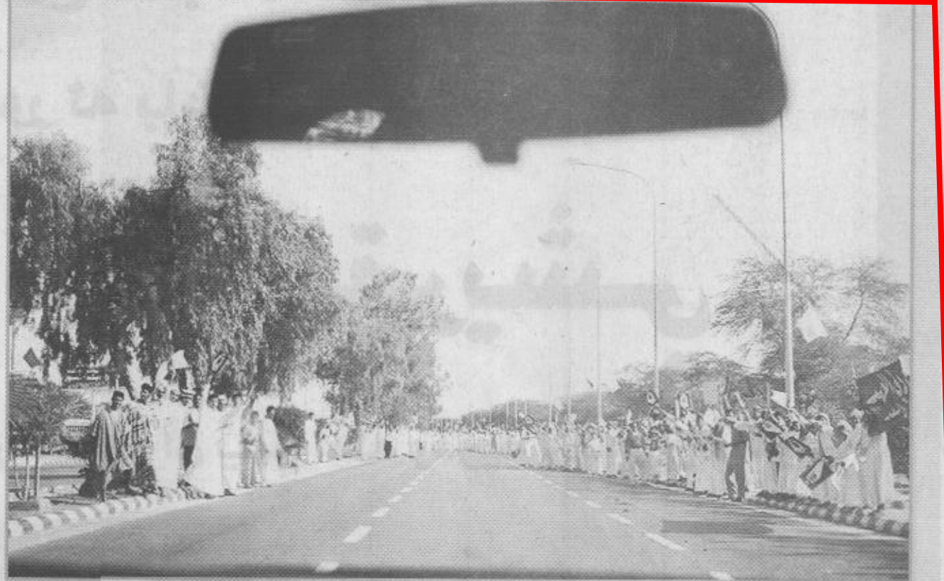
الجماهير خرجت لاستقبال سموه