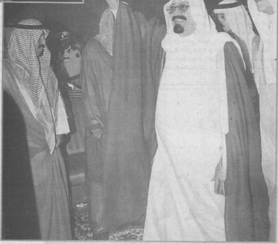
سو ولي العهد يحيى مستقبليه