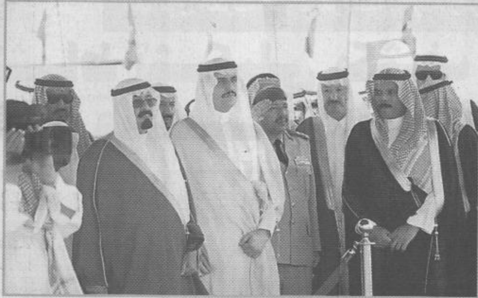
سو ولي العهد خلال افتتاح مصنع الأقمشة