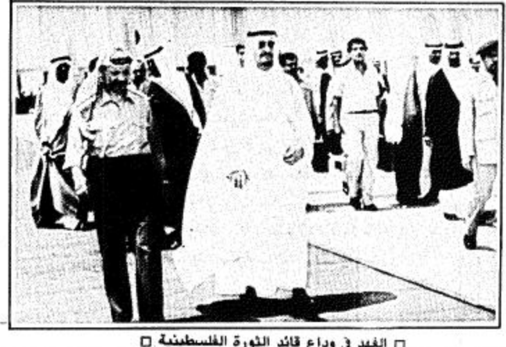
الملك في وداع قائد الثورة الفلسطينية

الخرطوم - الجب.. وصل السيد ياسر عرفات رئيس اللجنة التنفيذية لمنظمة التحرير الفلسطينية بعد ظهر أمس إلى الخرطوم في زيارة رسمية للسودان تستغرق ٢٤ ساعة قادماً من جدة وكان في استقباله في مطار الخرطوم اللواء عمر محمد الطيب نائب الأول لرئيس الجمهورية وعدد كبير من الوزراء.. ويرافق ياسر عرفات كل من خليل الوزير (ابو جهاد) عضو اللجنة التنفيذية لمنظمة التحرير الفلسطينية والمسئول العسكري الفلسطيني الرئيسي وسيزور ياسر عرفات معسكره الواقع على بعد ١٧٠ كيلو متراً شمال