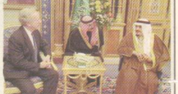
خادم الحرمين الشريفين لدى استقباله عضو مجلس الشيوخ الأمريكي الرياض - واس

استقبل خادم الحرمين الشريفين الملك فهد بن عبدالعزيز آل سعود في مكتبه في قصر اليمامة أمس عضو مجلس الشيوخ الأمريكي السناتور جوزيف آي ليرمان والوفد المرافق له. وأكد ليرمان خلال اللقاء على عمق العلاقات بين البلدين الصديقين وأهمية دعمها واستمرارها. واستقبل خادم الحرمين الشريفين أمس سفراء معينين استمعوا لتوجيهاته - ابده الله - كما استقبل سفير مملكة نيبال لدى المملكة بدرى برساد نغال