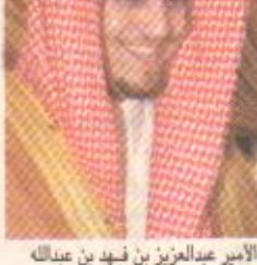
الأمير عبدالعزيز بن فهد بن عبدالله

الأهلية ولجنة برنامج الأمير محمد بن فهد لتأهيل وتوظيف الشباب السعودي. وقد أعرب سمو الأمير عبدالعزيز بن فهد بن عبدالله عن شكره لصاحب السمو الملكي أمير المنطقة الشرقية علي ثقة سموه سائلًا الله التوفيق ليكون عند حسن الظن.