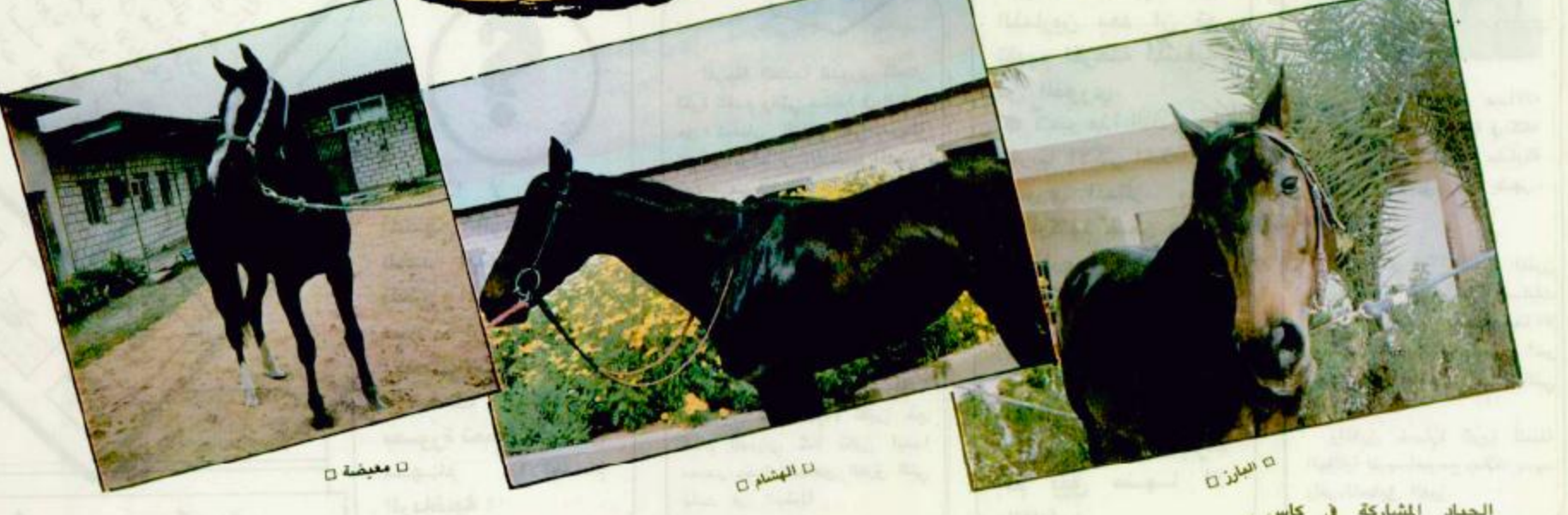
الجياد المشاركة في كأس صاحب السمو الملكي وفي العهد حازت على عدة كؤوس نوردها على النحو التالي: البارز حاز على كأس المهرجان الوطني للتراث والثقافة ١٤١٠/٦/١٨ هـ كأس الموانئ ١٤١٠/٦/٢٥ هـ نواف فاز بسبيرة الأمير بدر ١٤١٠/٥/٢٧ هـ عبد نال كأس المالية ١٤١٠/٥/٢٧ هـ الهشام حقق كأس الخطوط ١٤١٠/٤/٢٢ هـ كأس الامن العام ١٤١٠/٤/٢٩ هـ هداب فاز بكأس البنك السعودي الاسريكي ١٤١٠/٦/١١ هـ ثابت - وفق للفوز بكأس جامعة الملك عبد العزيز ١٤٠٩/١/٣ هـ وكأس الاعلام ١٤٠٩/٧/٧ هـ كأس البنك السعودي الاسريكي ١٤٠٩/٣/٢١ هـ وكأس رعاية الشباب ١٤٠٩/٤/١٢ هـ

الكأس ولو اني اتوقع ان ذلك صعب لقوة الجياد الأخرى المشاركة في هذا الشوط