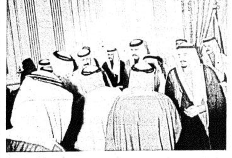
□ خدم الحرمين الشريفين يستقبل جموع المعزين بحضور سمو ولي العهد □