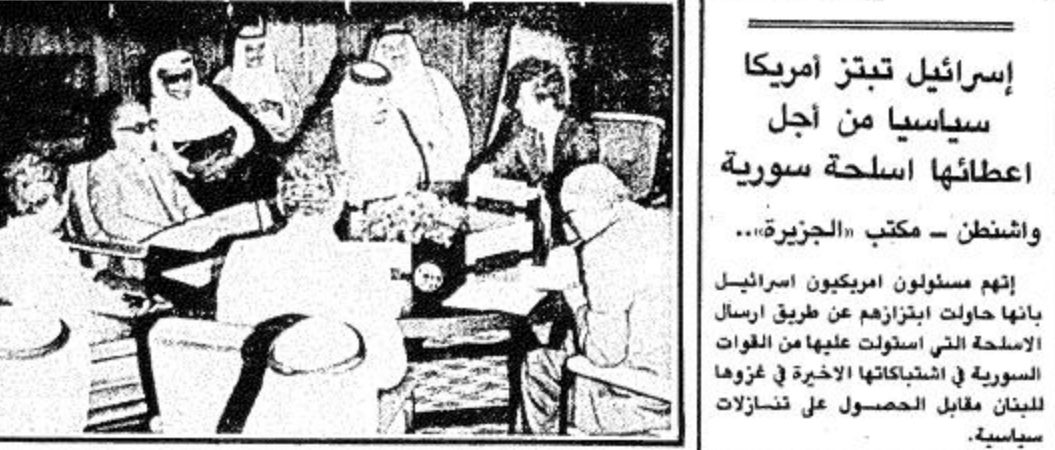
اجتماع وزراء الخارجية العرب برئاسة سمو وزير الخارجية

الطائف: من عدنان المهنا... رفعت اللجنة السداسية المنبثقة عن المؤتمر الطائفي لوزراء الخارجية العرب اجتماعاتها في الساعة الواحدة من بعد منتصف ليلة أمس برئاسة صاحب السمو الملكي الأمير سعود الفيصل وزير الخارجية وستستأنف اللجنة اجتماعاتها صباح اليوم. وأعلن سمو الأمير سعود الفيصل عقب اجتماعات اللجنة أنه تم خلال هذه الاجتماعات بحث تنفيذ قرار الجامعة العربية المتعلق بإزالة العدوان الاسرائيلي على لبنان وما يمكن للامة العربية ان تتخذة ازاء هذا العدوان... وأعرب سموه عن قلقه ازاء تحقيق ما يهدف اليه مجلس الجامعة في اجتماعه الاستثنائي الأخير.. وقال اننا سنستل باذن الله الى الاتفاق حول الخطوات التي نسومي باتخاذها..