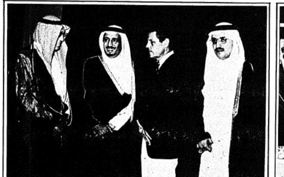
□ حديث ودي بين الامير سلمان والقصبي □