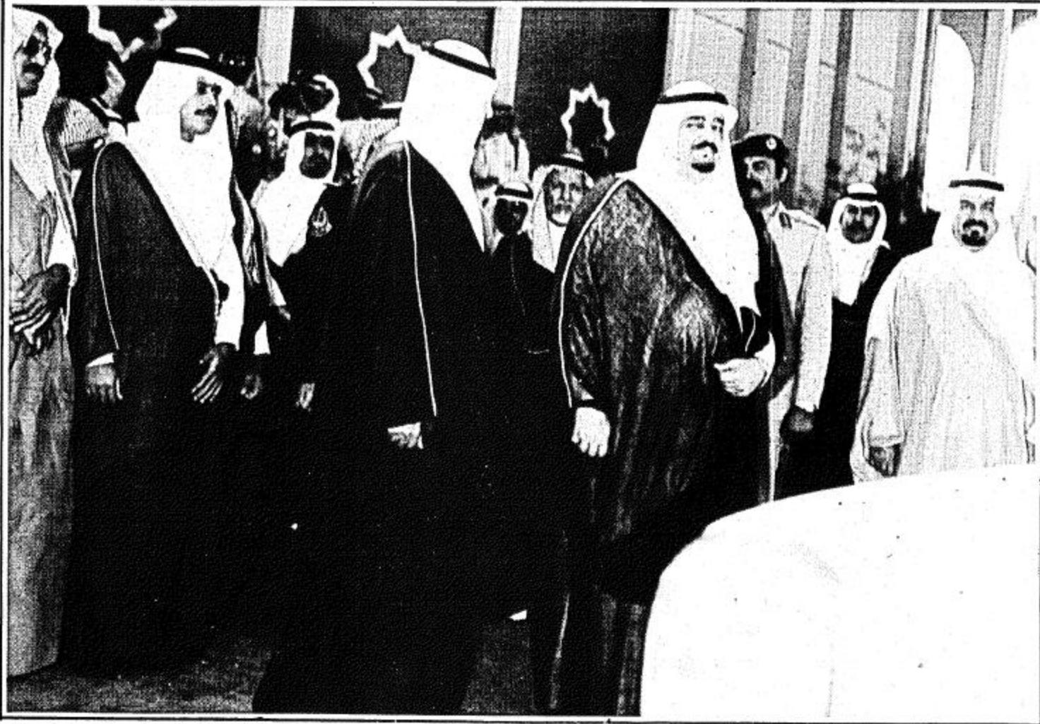
لحظة وصول جلالة الملك المعظم الى مكان الحفل □

« أشكر أخي الأمير عبد الله على تبني هذا المؤتمر العظيم .. وأكرر شكري للمشاركين .. »