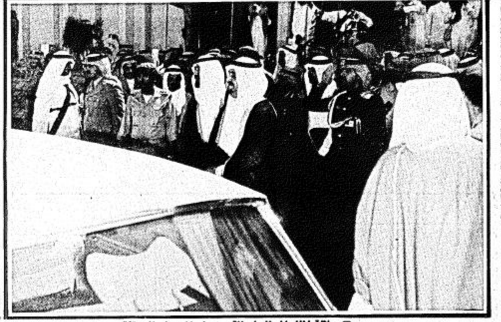
جلالة الملك المعظم لحظة وصوله الى مكان الاحتفال