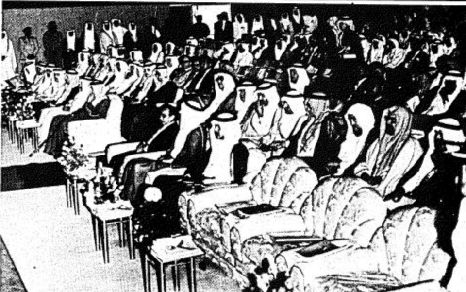
□ جانب من الحضور □

كلمة وزير الصحة بعد ذلك القى معالي الدكتور غازي القصبي وزير الصحة كلمة بهذه المناسبة هذا نصها بسم الله . لا يضر مع اسمه شيء في الارض ولا في السماء والحسد لله علم الانسان ما لم يعلم . والصلاة والسلام على نبي الملحمة ونبي الرحمة بعد صاحب الجلالة الملك المعظم صاحب السمو الملكي وولي العهد ونائب رئيس مجلس الوزراء ورئيس الحرس الوطني صاحب السمو الملكي النائب الثاني لرئيس مجلس الوزراء ووزير الدفاع والطيران اصحاب السمو اصحاب المعالي والفضيلة والسعادة ايها الحفل الكريم السلام عليكم ورحمة الله وبركاته ورعا الله يا ابا فيصل وانت تحضن لقاء العلم . ولا يستوي الذين يعلمون والذين لا يعلمون . وتبارك مندى الحكمة . والحكمة ضالة يطلبها المؤمنون . وتساند جهود البحث . والحقيقة اينة البحث . ولا غرو ولا عجب فانت تتلمي الى دين انزل لقوم يتفكرون وفضلت اياته ان يعقلون . ولا غرو ولا عجب فانت ابن حضارة اهدت العلم الطب والفلك والحساب - واعلمته