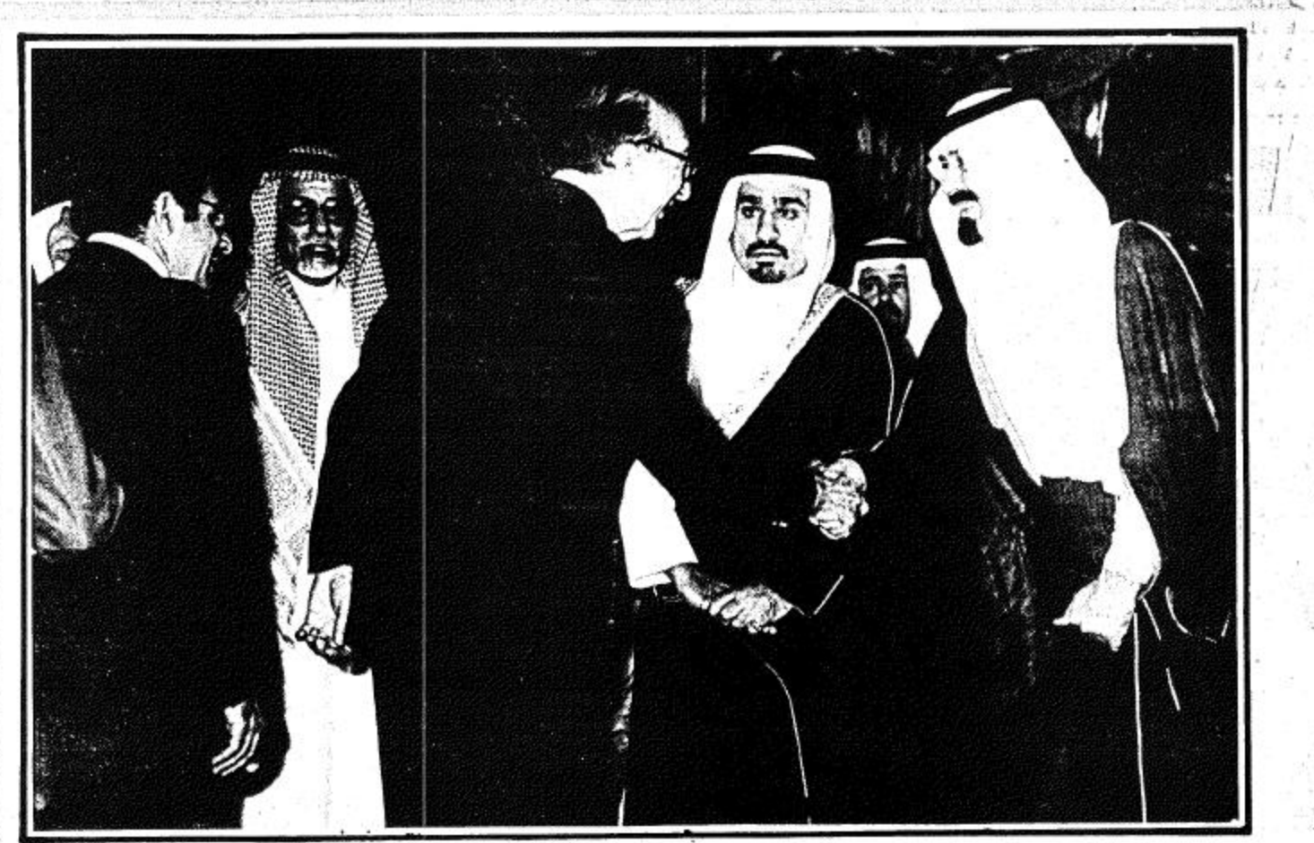
سمو ولي العهد يستقبل الاطباء في حفل العشاء امس