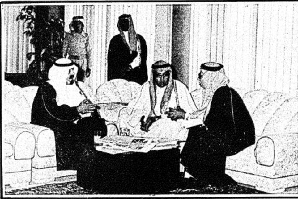
توجيهات من سمو ولي العهد للتوجيهي والقصيبي