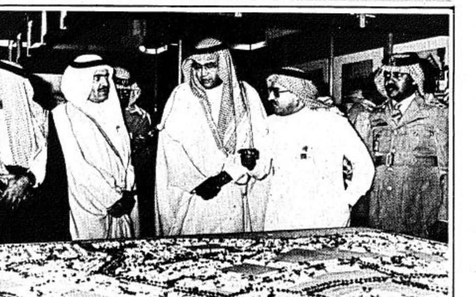
□ القصبي اساء افتتاح المعرض □