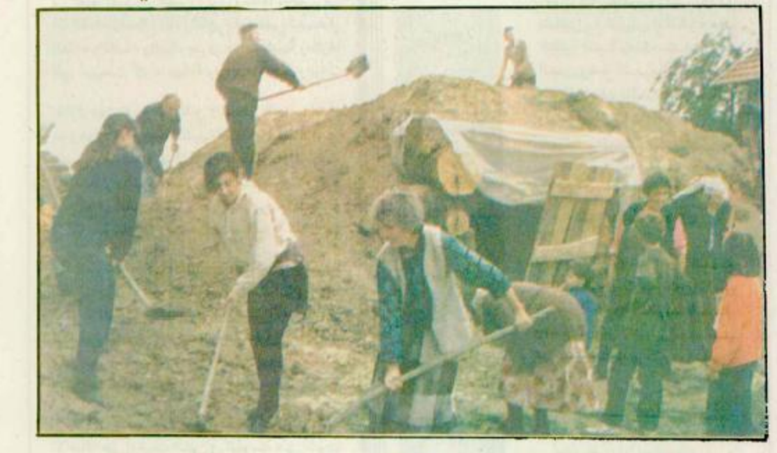
قرويون كرواتون من جنجا بالقرب من مدينة ذوبانجا يقفون سائرا ترابيا بين منازلهم الصربية في البوسنة

الاحتياجات الانسانية في البوسنة تتضاعف وعدد المحتاجين يقترب من المليون نسمة