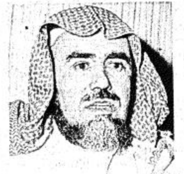
□ مغل المغل

المقبلة يتراأس الجلسة العمومية لجمعية الملك عبد العزيز الخيرية بتبوك