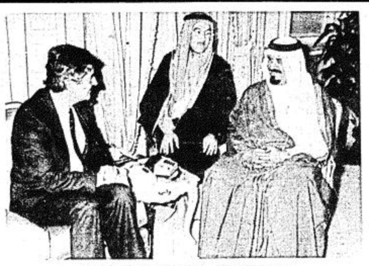
□ سمو النائب الثاني يستقبل رئيس وزراء هولندا