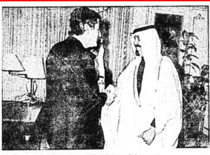
□ سمو ولي العهد يستقبل رئيس وزراء هولندا