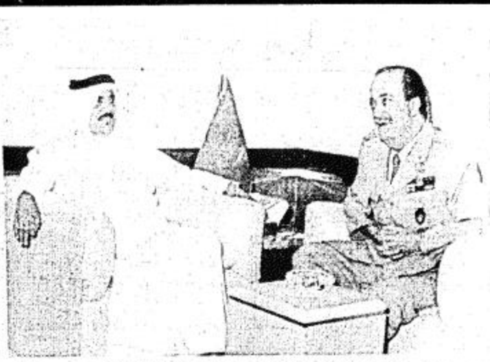
□ مساعد وزير الدفاع والطيران يستقبل قائد المنطقة الوسطى بروما