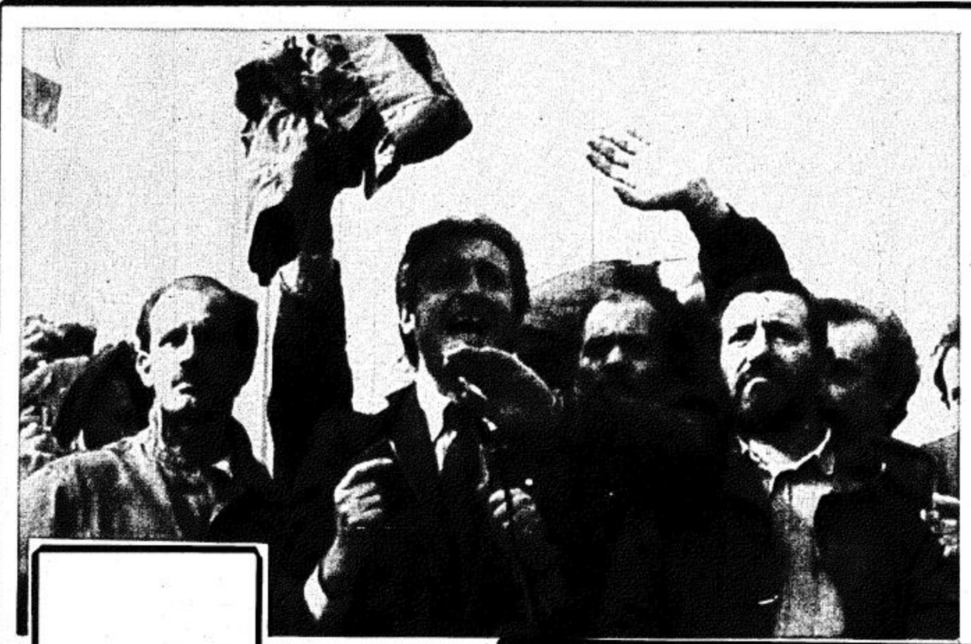
□ ميلانو - إيطاليا - أ.ب. سرجيو أوتونيو زعيم اتحاد العمال يتحدث إلى جماهير العمال الغاضبة وقد احتاط به عدد من رجال الأمن لاحتفائه يوم الثلاثاء الماضي حيث اشتد حواجا ٨٠٠٠ عامل ومواطن في مظاهرة جابت شوارع ميلانو احتجاجا على فرض الضرائب الجديدة وخفض الإنفاق الحكومي □