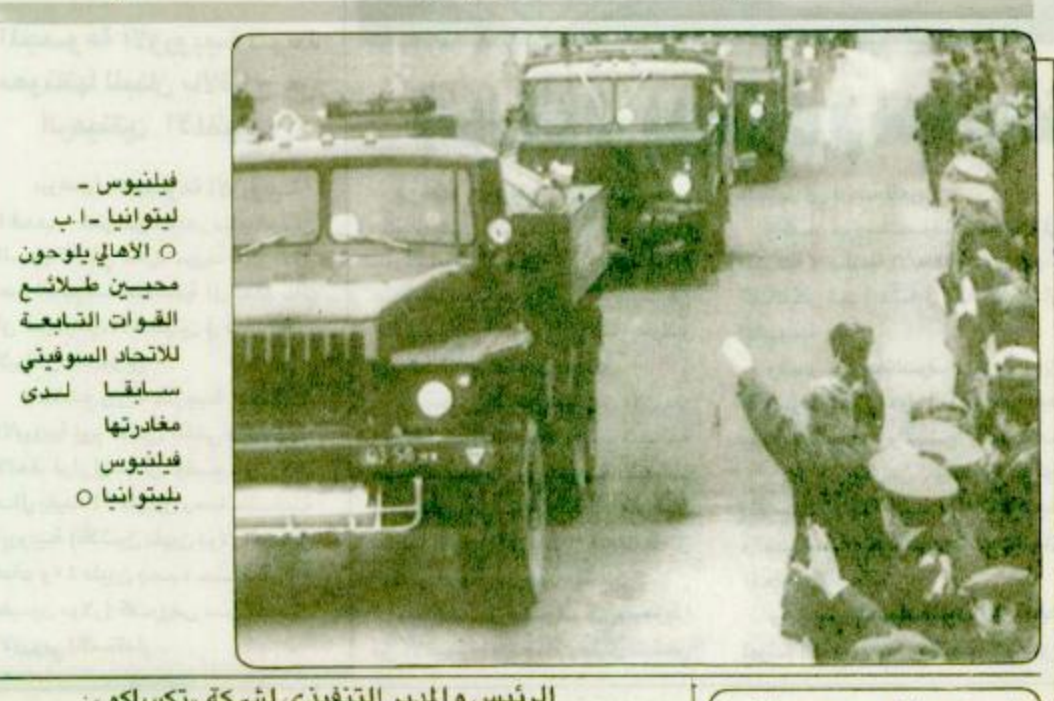
الرئيس والمدير التنفيذي لشركة «تسكاكو» - فيلينيوس - ليتوانيا - ا. ب. الاهالي بلوحيون محبين طلائع القوات الشعبية للاتحاد السوفيتي سابقا لدى مغادرتها فيلينيوس بليتوانيا

تلقى خادم الحرمين الشريفين الملك فهد بن عبدالعزيز آل سعود رسالة من ساحة الشيخ عبدالعزيز بن عبدالله بن باز الرئيس العام لإدارات البحوث العلمية والإفتاء والدعوة والإرشاد فيها يلي نصها الذي اوردته (واس) : من عبد العزيز بن عبدالله بن باز الى حضرة خادم الحرمين الشريفين الملك الكريم فهد بن عبدالعزيز ملك المملكة العربية السعودية وفقه الله ما فيه من رضاه ونصرة دينه آمين. السلام عليكم ورحمة الله وبركاته أما بعد. فلقد أطلعت على خطابكم الكريم الموجه الى المواطنين والمثقفين وسائل الاعلام حول منح الملكة العربية السعودية الذي تشر عليه في الحكم من عهد الملك عبدالعزيز - رحمه الله - وقيل ذلك في عهد الامير الامام محمد بن