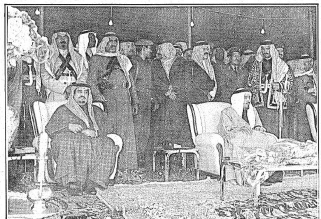
جلالة الأب.. والفهد الأمين في حفل أهالي حائل أمس

حائل - بعثة (الجزيرة) - وواس - يصل جلالة الأب القائد الملك خالد بن عبد العزيز إلى الرياض قادماً من حائل في ختام جولته التفقدية لمنطقتي القصيم وحائل.. بهدف الاطلاع على احوال المواطنين وتفقد احوالهم ومناقشة احتياجاتهم ومطالباتهم هناك.. وقد اعرب جلالتة عن سعاده الغامرة بلقاء اهالي منطقة حائل.. كما عبر سموه في العهد الامين عن فرحته وغبطته بهذا اللقاء.. وجاء ذلك في تصريح لعمالي وزير الاعلام.. وكان جلالتة قد شرف بعد ظهر امس الحفل الكبير الذي اقامته امانة واهالي منطقة حائل تكريماً لجلالتة وحضر الحفل سموه في العهد ونائب رئيس مجلس الوزراء وسمو النائب الثاني ورئيس الحرس الوطني وسمو امراء المناطق - الرياض - القصيم - تبوك - وعدد من اصحاب السمو الملكي الامراء والمعالى الوزراء وكبار المسؤولين.. وقد القيت في الحفل عدد من الكلمات والمصالحات الترحيبية بمقدم جلالتة.. وكان جلالتة قد استقبل صباح امس في قصر الامارة بحائل جموع المواطنين من ابناء مدينة حائل وضواحيها الذين توافدوا منذ الصباح الباكر للسلاام على جلالتة