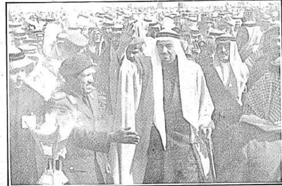
● جلالة الاب يحيي المواطنين في منطقة حائل ●