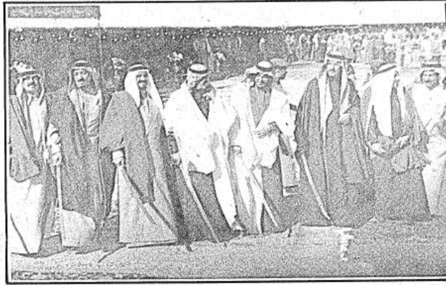
● عدد من اصحاب السمو الملكي الامراء يشتركون في العرضة النجدية ●