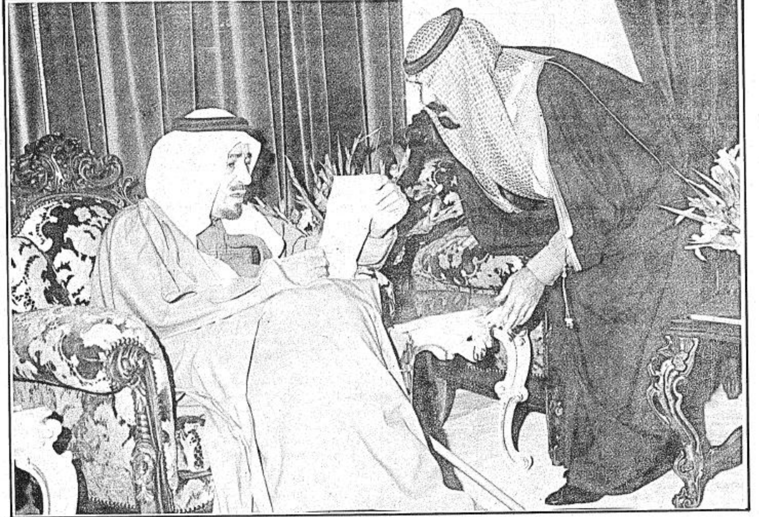
● سمو النائب الثاني يستمع الى توجيه من الاب القائد ●