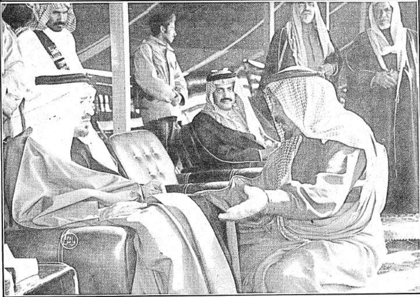
● جلالة القائد يستمع الى احد المواطنين ●