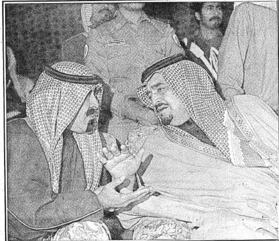
● حديث بين الفهد والامير عبدالله حول التلاحم بين القائد وشعبه ●