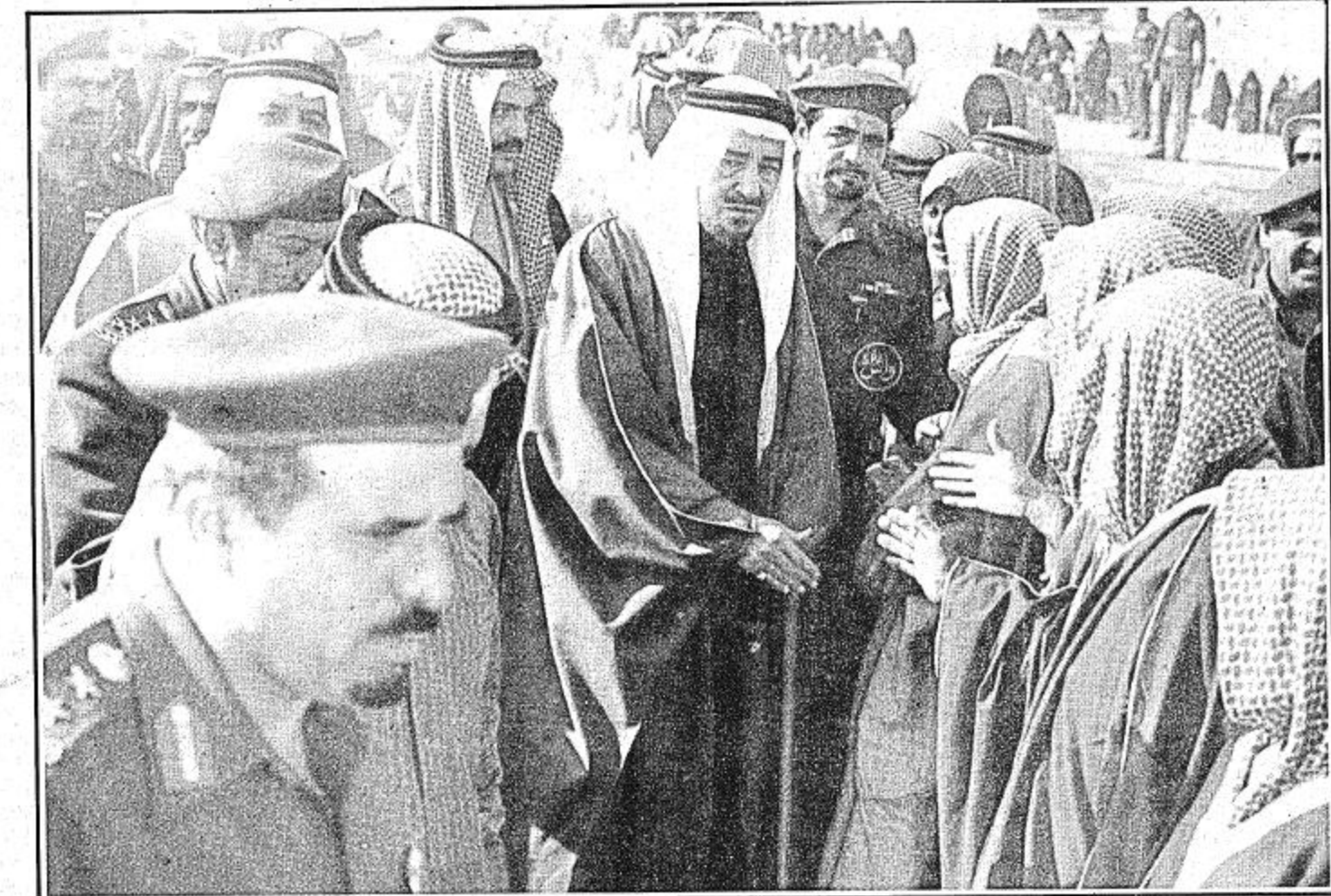
● الاب القائد يقف مستمعاً الى احد المواطنين في حائل ●