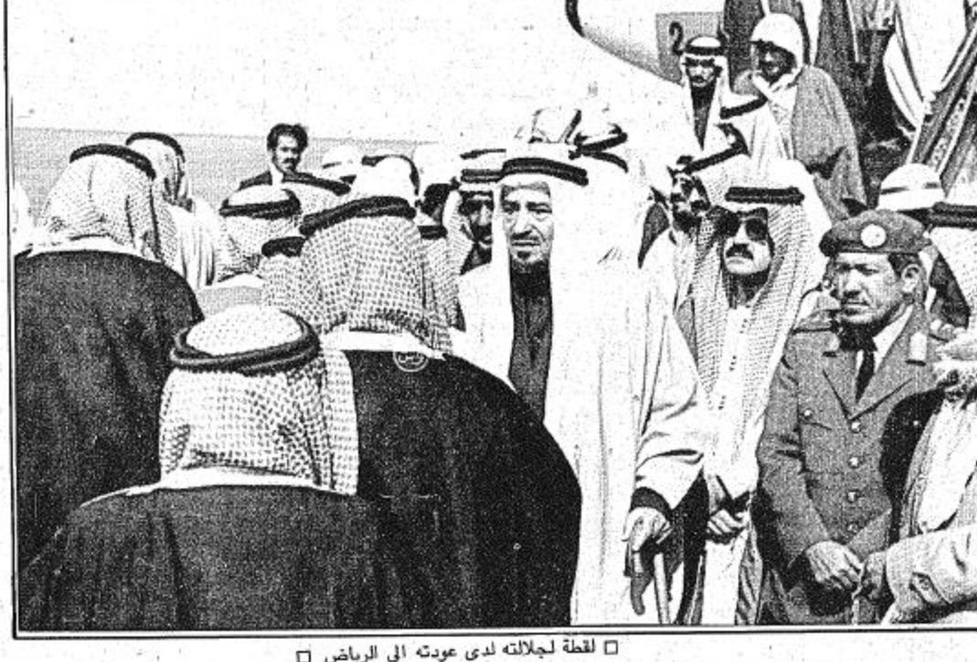
اللقاء لجلالته لدى عودته إلى الرياض

صديق الهدف وحجم الإنجاز وصف سمو الزيارات التي يقوم بها جلالته الملك الفهد بن عبد العزيز بن سعود النائب الثاني لرئيس مجلس الوزراء ورئيس الحرس الوطني محافظاً على ممتلكاتنا الحبيبة بلقاء مؤثرات خلقية تبرز سمو الهدف وحجم النتائج الإيجابية التي ترتبت وترتبط على هذه الزيارات الكريمة. وأضاف أن مسيرة الخير قد أثمرت مجتمعاً متحضرًا يفتخِر بمواظف مواطنيه يبعثون على إعجاب المجتمع الحديث المتطور وتكون منطقة حائل كواحدة من مناطق المملكة الغالية قد حظيت ونشرت بزيارة جلالته الملك المعظم وهو في عهده الأمين وسمو النائب الثاني وأصحاب السمو الملكي الأمراء وأصحاب المعالي الوزراء وكبار المسؤولين في الدولة وعلى هامش هذه الزيارة الملكية الكريمة سيكون هناك عدد من المشاريع الحيوية الهامة للمنطقة التي نأمل أن يكون تنفيذها دعامة قوية في سبيل تطويرها واستكمال مرافقها وخدماتها الأمر الذي يسؤري أن تهيئه الظروف المناسبة للمواطنين فيها على مختلف مستوياتهم.