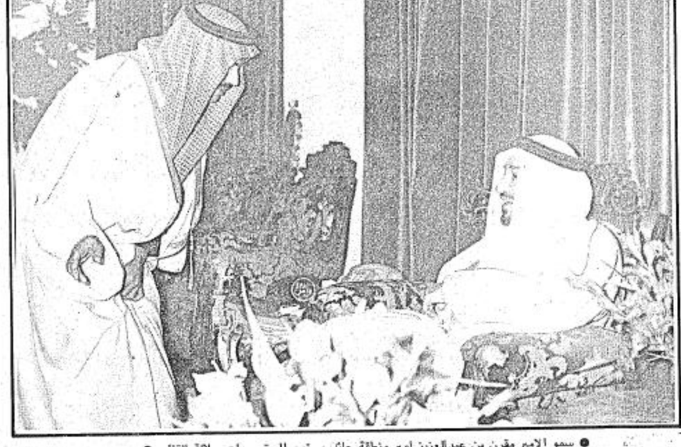
● سمو الامير مقرن بن عبدالعزيز امير منطقة حائل يستمع الى توجيهات جلالة القائد ●