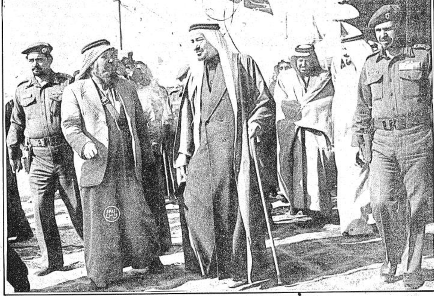
● جلالة الملك في حديث مع احد المواطنين وهو في طريقه الى الحفل ●