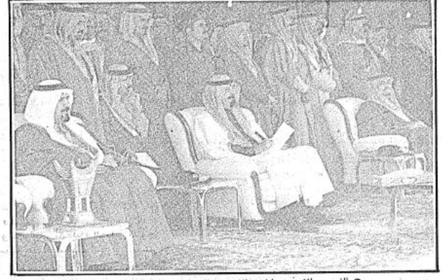
● الفهد... والامير عبدالله... فالامير سلطان في حفل امالي حائل ●