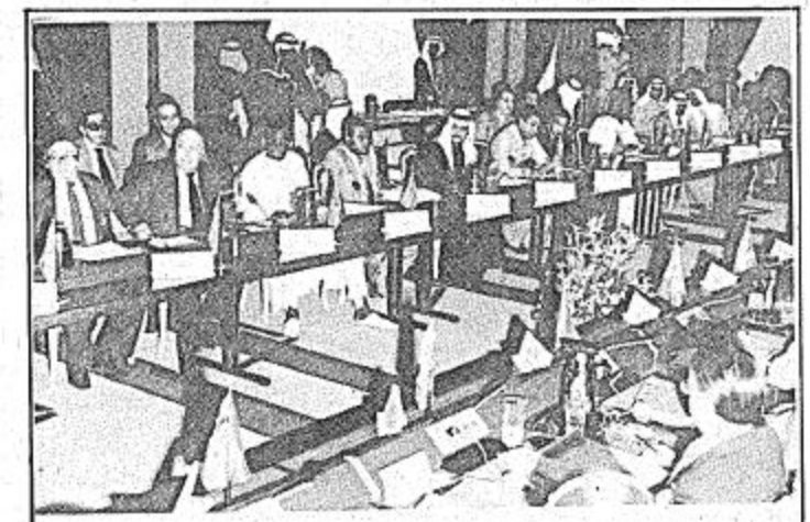
□ لحظة لاجتماع اللجنة السياسية □

الطائف/بعدة الجزيرة: واس من المقرر ان ينهي مؤتمر وزراء خارجية الدول الإسلامية المنعقد حالياً في الطائف أعماله اليوم.. بعد ان يجيز جميع التوصيات التي قامت بوضعها اللجان المتخصصة وهي السياسية، والاقتصادية، والثقافية، والتي تمثل في مجملها مجموعة البنود التي سوف يتضمنها جدول أعمال مؤتمر القصة الإسلامية الثالثة الذي سيعقد في مطلع الاسبوع القادم بمكة المكرمة. هذا ومن ناحية أخرى صرح صاحب السمو الملكي الأمير سعود الفيصل وزير الخارجية، ورئيس المؤتمر ورئيس اللجنة السياسية ان اللجنة قد فرغت من اجازة وثيقة لجنة القدس والتي تعد من ابرز وثائق مؤتمر القمة الإسلامية الثالث.