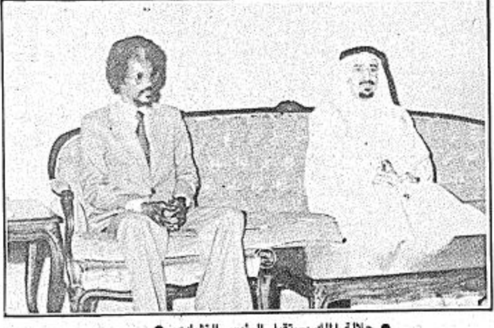
جلالة الملك يستقبل الرئيس التشادي ●

اجتماع جلالة الملك الحسن الثاني في مقر القمته ● الطائف - بعثة «الجزيرة»: - قضى جلالة الملك خالد بن عبدالعزيز يوم أمس معظم وقته في مطار الحويه بالطائف الذي انشأه جلالة الملك عبدالعزيز طيب الله ثراه حيث كان استقبال زعماء وقادة العالم الإسلامي الذين بدأوا بالوصول وسوف يتواصل البقية هذا اليوم. وكان جلالة الملك الاب طالول الاستقبال بادي الابتسام يتبادل الاحاديث مع الضيوف الذين قدموا من كافة انحاء الارض للمشاركة في اول اجتماع تاريخي لزعماء المسلمين في اعلم مكان مقدس. وكان الملك الحسن الثاني ملك المغرب