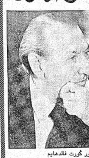
الدكتور كورت فالدهايم

○ نيويورك/ خاص بالجزيرة - عشية مغادرته نيويورك الى الطائف افضى السيد كورت فالدهايم السكرتير العام للأمم المتحدة.. بحديث (للجزيرة) قيم فيه اهمية المؤتمر الإسلامي وثمن فيه دور المملكة العربي والعمالي والاسلامي.. وقد وافانا مراتلثا في نيويورك احمد حسين البامي بغحوى هذا الحوار مع الجزيرة: ● ما هو تقييمك لاهمية التزيت والمكان الذي اختير لعقد مؤتمر القة الاسلامي، وهل تعتقد ان هذا الاختيار سيبلغ دورا كبيرا في تحقيق نتائج طيبة من المؤتمر؟ - من الواضح فهذا مؤتمر للول الاسلامية البقية ص ٢٢