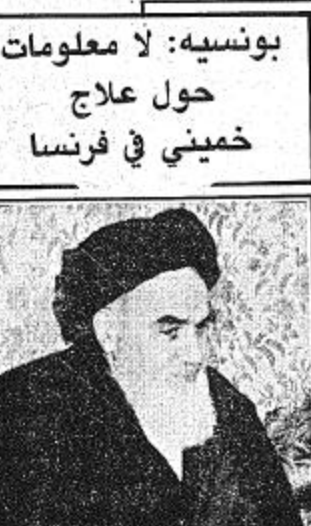
بونسنيه: لا معلومات حول علاج خميني في فرنسا

مصدره تروي لنا الجزيرة: ● المملكة تحافظ على إستراتيجيتها ولا جديدي في الأسعار .. كتب - خالد الرجيعي .. تتوالى لدى المسؤولين البترولين في المملكة انباء عن بدء كل من العراق وايران بتصدير جزء من انتاجهما البترولي، مما يترك تسائلا حول ما اذا كانت المملكة سوف تتخذ قرارا بخفض انتاجها البترولي، وهذا ما اشار اليه مصدر مسؤول مؤكدا ان هذا القرار سواء كان تخفيضا او زيادة مرهون بالجهات العليا في الدولة. وأشار الى ان المملكة لم تتخذ حتى الان اي اجراء فيما يتعلق بالكميات البترولية المنتجة حاليا، والتي تمت زيادتها بعد توقف انتاج العراق وايران بسبب الحرب الدائرة بينهما. حيث ان المملكة قامت برفع انتاجها الى ١٠,٣ مليون برميل يوميا مقابل ٩,٥ مليون برميل في اليوم قبل الحرب بين البلدين. وذلك لان العراق لم تنتج سوى ٤,٥ الف برميل في اليوم في مقابل ٣,٤ مليون برميل في اليوم قبل بدء الحرب، بينما لم تنتج ايران سوى ١,٥ الف برميل يوميا في مقابل ١,٣ مليون برميل قبل بدء الحرب. وكانت اثناء قد تردت مؤخرا في الدوائر البترولية الايرانية بان المملكة تعتمد الحفالة على انتاجها من البترول بالمستوى الحالي وهو نحو عشرة ملايين برميل يوميا على الاقل حتى تتراس القاد. البقية ص ٢٢