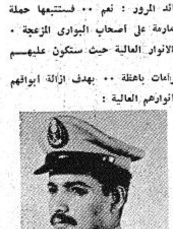
قائد المرور : نعم .. فستبعتها حملة معارضة على اصحاب البواري المزجة .. والاتوار العالية حيث ستكون عليهم غرامات باهظة .. بهدف ازالة ابواقهم وتوارهم العالية :

ان المرور لا يهدف الى الاستفادة من هذه الغرامات .. وانما جاء هذا نتيجة ما زائنا من تفاهت الحوادث واستهتار بعض السائقين .. وطلب قائد المرور من المواطنين ان يتعاونوا مع المرور في اجراءاته هذه التي هدف منها البقاء على ارواحهم وعل ادراج اسرهم .. وشكر .. العربي .. الصحافة .. وقال : اننا نرحب باي نقد موسوعي ونفريه ونطقتنا .. فنحن نتعاون جميعا لخدمة وطننا ومواطنينا