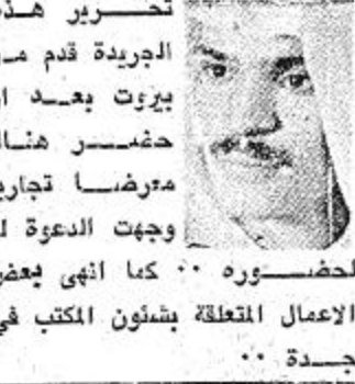
الأمير خالد بن فهد يزور مركز العلوم

A Group of Construction Companies Housing Comany ( under New Construction and establishment ) is in need of a group of national or foreign companies to undertake construction of a large number of villas and houses in accordance with the most modern technical and structural designs at Khurais Road Area . For detailed information, Please contact Construction and Housing Company P.O. Box 4133, Riyadh - Saudi Arabia