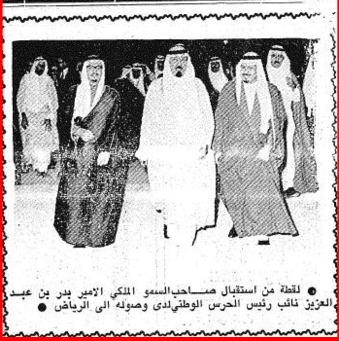
لقطة من استقبال صاحب السمو الملكي الأمير بدر بن عبد العزيز نائب رئيس الحرس الوطني لدى وصوله إلى الرياض •