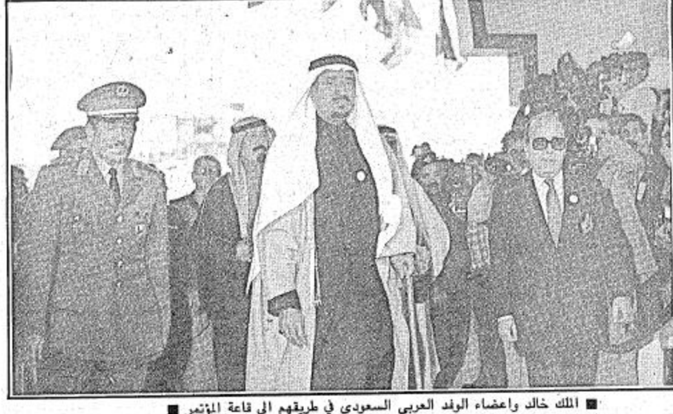
الملك خالد وأعضاء الوفد العربي السعودي في طريقهم إلى قاعة المؤتمر

الفهد يترأس جلسة العمل الثانية للقمة سموه يطالب بحقن الدماء وحل النزاع العربي الإسرائيلي وانسحاب إسرائيل والسوقية من فلسطين وأفغانستان الطائف - بعثة الجزيرة: عقد مؤتمر القمة الإسلامي الثالث في الساعة العاشرة والنصف من مساء أمس جلسة العمل الثانية برئاسة صاحب السمو الملكي الأمير فهد بن عبدالعزيز في العبد ونائب رئيس مجلس الوزراء وحضور قادة وأعضاء الدول الإسلامية المشتركة فيه. وقد شكر سموه في بداية الجلسة جلالة الملك خالد بن عبدالعزيز المفدى رئيس المؤتمر الذي أتاب سموه في رئاسته.. كما أعرب عن شكره لأصحاب الجلالة والفضامة والسمو ملوك ورؤساء وامراء الدول المشتركة في المؤتمر على موافقتهم على الانابة. والقى سمو الأمير فهد بن عبدالعزيز بعد ذلك كلمة استعرض فيها موقف المملكة من مختلف القضايا السياسية والاقتصادية والاجتماعية والثقافية المطروحة على المؤتمر. وقد أكد سموه ان السلام العادل في الشرق الاوسط لا يقوم الا على اساس الانسحاب الإسرائيلي الكامل من الأراضي العربية المحتلة وتحرير القدس واستعادة الشعب الفلسطيني لحقوقه المشروعة واقامة دولته على ارضه بقيادة منظمة التحرير الفلسطينية. وطالب سموه الاتحاد السوفياتي بسحب قواته من أفغانستان وقال ان على الاتحاد السوفياتي ان يكون منسجماً مع مناداته للسلام ويسحب قواته من الأراضي الأفغانية. كما طالب صاحب السمو الملكي الأمير فهد بحقن الدماء وحل النزاع العربي الإسرائيلي بالطرق السلمية وقال كما كان بوجدنا ان نشاركنا إيران في هذا المؤتمر لان القضية الفلسطينية، لمناسبة نيابة رئاسة المؤتمر. البيقية ص ٢٢