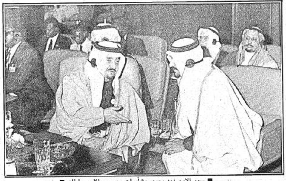
سمو الأمير فهد يجري مشاورات مع سمو الأمير سلطان