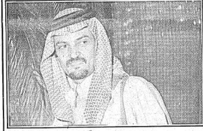
سمو الأمير سعود الفيصل

أكد جلالة الملك خالد بن عبدالعزيز المفدى للسيد ياسر عرفات رئيس منظمة التحرير الفلسطينية بان اجتماع قادة المسلمين في جوار الكعبة وفي بيت الله الحرام في دورة مؤتمرهم الذي سمي بمؤتمر فلسطين والقدس ان هو الا عهد وثيق بين المسلمين على تحرير القدس الشريف.. اعلم ذلك صاحب السمو الملكي الأمير سعود الفيصل وزير الخارجية في رده على سؤال لوكالة الأنباء السعودية حول ما تقدم به السيد ياسر عرفات من اقتراح بإلقاء عهد ينص على تحرير القدس في الجلسة الافتتاحية لمؤتمر القمة الإسلامية في المسجد الحرام. واضاف سموه ان ما ورد في خطاب جلالة الملك خالد بن عبدالعزيز في الجلسة الافتتاحية للمؤتمر من دعوة مخلصه وتوسيع جاد على تحرير القدس والأراضي الفلسطينية والعربية المحتلة انما هو النداء العمل الحقيقي الى حشد الامكانيات الاسلامية وهو بمثابة العهد الذي اخذه قادة الامة الاسلامية على انفسهم وما زالوا عاقدين العزم على الوفاء به والنضحية في سبيله. وقال سموه ان الجهاد في سبيل التحرير نداء اطلقته حكومة جلالة الملك على لسان صاحب السمو الملكي الأمير فهد بن عبدالعزيز ونائب رئيس مجلس الوزراء منذ عدة واما تزال حكومة جلالة الملك تسعى مع شقيقاتها الدول الاسلامية على وضعه موضع التنفيذ بالاعادة للجهاد بكل وسائله ومعانيه.