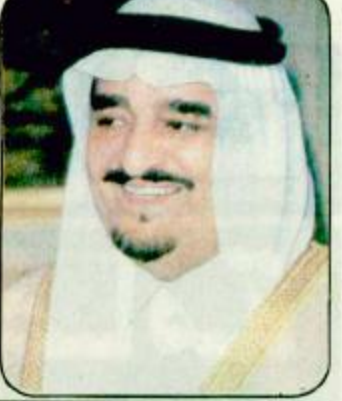
مبارك ومنجستو اجتمعا بالقاهرة

الملكة دعمت جهود الشرعية لادراج لبنان في قائمة الدول المتضررة من عدوان العراق بيروت / مراسل الجزيرة: أعربت مصادر في الحكومة اللبنانية لـ «الجزيرة» عن تقدير لبنان ورئيسا حكومة وحكومة وشعبا لموقف الملكة المبدئي من أزمة لبنان والخط المستقيم الذي التزمته سياسة الملكة تجاه لبنان لمساعدة جهود إنعاشه في إطار الشرعية اللبنانية لتخليص لبنان وشعبه من أزمة الحرب الأهلية، ودعم جهودهم لتكريس الأمن والسلام وإعادة بناء