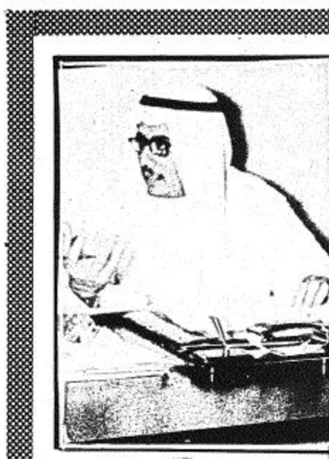
استغرق منه حوالي ستة أشهر يمتد خلالها التدريب مكاتباً مالية قدرها ثلاثمائة ريال بالإضافة إلى تأمين وسيلة المواصلات من وإلى المركز كما يمنح شهادة فنية تمكنه من العمل الفني في الحكومة أو الشركات. كما أوضح أن المن التي يتم التدريب عليها هي ميكانيكا السيارات والتدريب والتكيف واللحام والتجهيزات الصحية والكهرباء والبناء والدخان وجراحة العمارات.

وأعلن الشيخ عبد الله مهدي أن تكاليف المرحلة الأولى للمشروع وصلت إلى حوالي مليار ريال ومائتين وعشرين مليون ريال وتستغرق مدة تنفيذه ٤٢ شهراً بدأت في منتصف عام ١٩٦٦. وقال إن مشروع المراقبة الجوية الجديد في المملكة يستلزم على ٢١ جهازاً أرضياً و١٢ جهازاً هبوطاً إلى مستوى عن متابعة الطائرة أثناء هبوطها حتى وصولها إلى المدرج. وأضاف أن هناك اتصالات بالالات بين جدة والرياض لأغراض الملاحة الجوية كما يشتمل على سبع محطات أجهزة اتصال مباشر أرض جو وجو أرض منها ثلاثة في الرياض والطيران وجدة بالإضافة إلى وجود مركز مراقبة جوية عامة في الرياض وجدة.