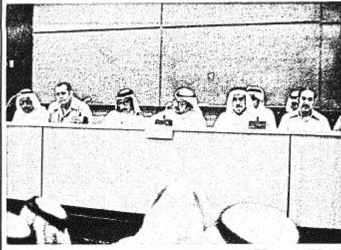
التدريب بالإضافة إلى بدل تغذية اسفاني وصرف بدل ترحيل للقاءهم في خارج منطقة التدريب الذين تزيد عدد تدريبهم على ٢ اشهر.

عدد من أبناء دولة الإمارات والبحرين وعمان والسودان يشكرون في برامج المعهد.