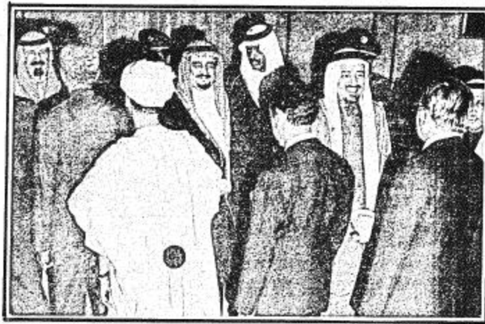
جلالة الملك يكرم السفراء

الرياض - وس - أقام جلالة الملك خالد بن عبد العزيز الفدي بعد مغرب اليوم بقصر جلالته بالمغرب حفل عشاء تكريماً لأصحاب السعادة السفراء ورجال السلك الدبلوماسي المعتمدين لدى المملكة الذين وصلوا عصر أمس إلى الرياض قادمين من جدة للتشرف بالسلام على جلالتهم. وقد حضر الحفل عدد من أصحاب السمو الملكي الأمراء يتقدمهم صاحب السمو الملكي الأمير فهد بن عبد العزيز ولي العهد ونائب رئيس مجلس الوزراء وصاحب السمو الملكي الأمير عبد الله النائب الثاني لرئيس مجلس الوزراء ورئيس الحرس الوطني. كما حضره أصحاب المعالي الوزراء ورجال الديوان الملكي وكبار المسؤولين من مدنيين وعسكريين.