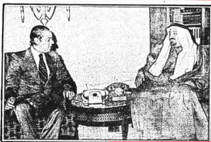
استقبالات جلالة الملك

الرياض - وس - أقام جلالة الملك خالد بن عبد العزيز الفدي بعد مغرب اليوم بقصر جلالته بالمغرب حفل عشاء تكريماً لأصحاب السعادة السفراء ورجال السلك الدبلوماسي المعتمدين لدى المملكة الذين وصلوا عصر أمس إلى الرياض قادمين من جدة للتشرف بالسلام على جلالتهم. وقد حضر الحفل عدد من أصحاب السمو الملكي الأمراء يتقدمهم صاحب السمو الملكي الأمير فهد بن عبد العزيز ولي العهد ونائب رئيس مجلس الوزراء وصاحب السمو الملكي الأمير عبد الله النائب الثاني لرئيس مجلس الوزراء ورئيس الحرس الوطني. كما حضره أصحاب المعالي الوزراء ورجال الديوان الملكي وكبار المسؤولين من مدنيين وعسكريين.