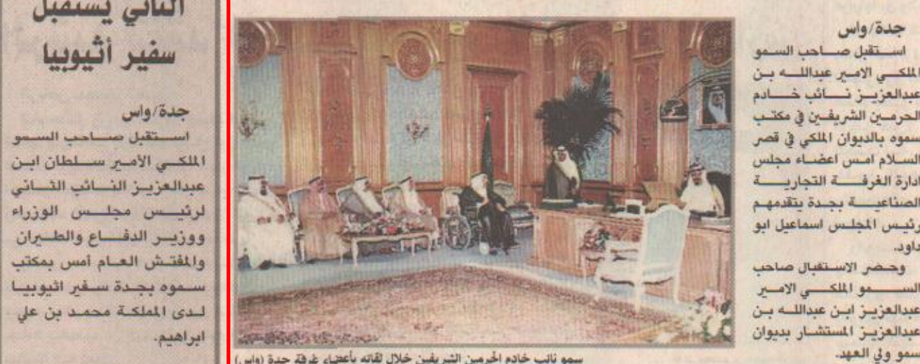
سمو نائب خادم الحرمين الشريفين خلال لقائه بأعضاء غرفة جدة