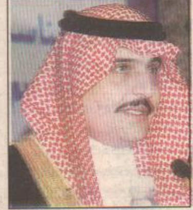
الامير محمد بن فهد

الدمام / ميعض حوصوة يرعى صاحب السمو الملكي الأمير محمد بن فهد ابن عبدالعزيز أمير المنطقة الشرقية يوم الثلاثاء القادم ١٣ من ابريل ١٩٩٩ ندوة (الويو) عن الملكية الفكرية واتفاق جوانب الحياة الفكرية المتصلة بالتجارة والتي تنظمها بالتعاون مع الغرفة التجارية الصناعية بالمنطقة الشرقية المنظمة العائبة للملكية الفكرية (الويو) وذلك بمقر الغرفة الرئيسي بالدمام وبمشاركة عدد من المختصين في هذا المجال . أوضح ذلك أمين عام الغرفة التجارية الدكتور ابراهيم عبدالله المطري . وقال إن هذه الندوة التي تستمر حتى الخامس عشر