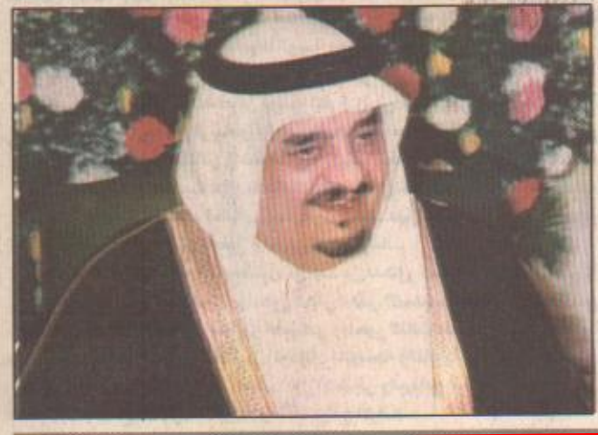
الارض وإشادت المجلة بالمستوى العمراني في الحرمين الشريفين الذي يعكس طابعها تقنيا عاليا من قباب يمكن فتحها وإغلاقها حسب الأحوال الجوية وظلال ضخمة تحار آليا تظل الأماكن المفتوحة من حرارة الشمس وكذلك جهاز تكييف الهواء المتقدم جدا في المسجد النبوي والذي يعد من أكبر أجهزة التكييف في العالم. ونوهت المجلة في ختام تحقيقاتها بمناخ خادم الحرمين الشريفين الملك فهد ابن عبدالعزيز وقالت إن هذه المشروعات ما كانت لتتحقق لولا تصميجه وعزمه.

عبدالعزیز الذي تشرف بلادہ بصوتہما ورعایتہما والافتخار بزوارہما مؤکدة أنها تعد من أبرز المشروعات الإنشائية في القرن العشرين. وأوضحت المجلة أن ثلاثة كتب صدرت مؤخرا «حول تطوير المسجد الحرام بمكة المكرمة والمسجد النبوي بالمدينة المنورة» مع احتفال المملكة بمرور مائة عام على تأسيسها على يدي الملك عبدالعزيز بن عبدالرحمن آل سعود. وهذه الكتب هي: «قصة التوسعة الكبرى» و«الفن المعماري للمسجد الحرام في مكة» و«الفن المعماري لمسجد الرسول في المدينة» عن شركة هازار للنشر في لندن. وقالت المجلة إن هذه الكتب سوف تسهم في التعرف بمراحل توسعة الحرمين الشريفين خاصة في عهد خادم الحرمين الشريفين الملك فهد بن عبدالعزيز إذ أن شريحة كبيرة من المهتمين خارج العالم الإسلامي لا يعرفون الكثير عما أنفق من أموال وجهود جسارة للوصول بالحرمين الشريفين إلى ما وصل إليه من مستوى عمراني متقدم وتوسعات عملاقة لاستيعاب الأعداد المتزايدة من حجاج بيت الله الحرام وزوار مسجد نبيه المصطفى صل الله عليه وسلم. وقالت المجلة في هذا الصدد إن المملكة العربية السعودية أنفقت أكثر من ٢٥ بليون دولار في أعمال التوسعة بما في ذلك المشروعات الملحقة بها مثل الطرق الجديدة والاتفاقيات وطوابق الخدمات التي تشمل أماكن لوقوف السيارات تحت