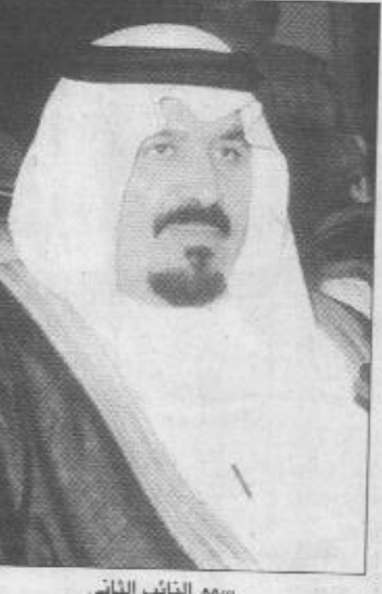
سمو النائب الثاني